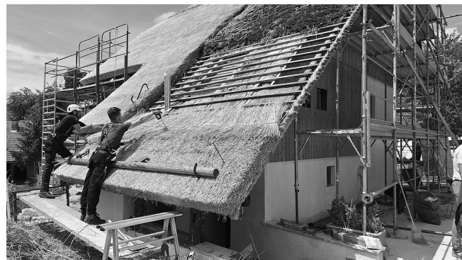
Slika 5: Sodobni način prekrivanja strehe s slamo na Trški gori.