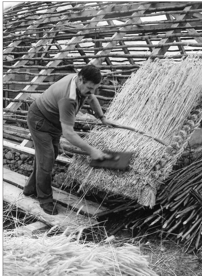
Slika 4: Tradicionalni način pokrivanja strehe s slamo na Livkovi zidnici na Homu (foto: Dušan Štepec, Zavod za varstvo kulturne dediščine Slovenije, OE Novo mesto, julij 2003).

letih prejšnjega stoletja (Koželj 1986, 1996). 4 Strehe so pokrivali maloštevilni starejši krovcji, ki so bili večji tega dela in s katerimi so sodelovali konservatorji s takratnih regionalnih zavodov za varstvo naravne in kulturne dediščine. Za starejšimi krovcji so slamokrovsko delo postopoma prevzemali mlajši poklicni slamokrovci (Kuhar 1993).