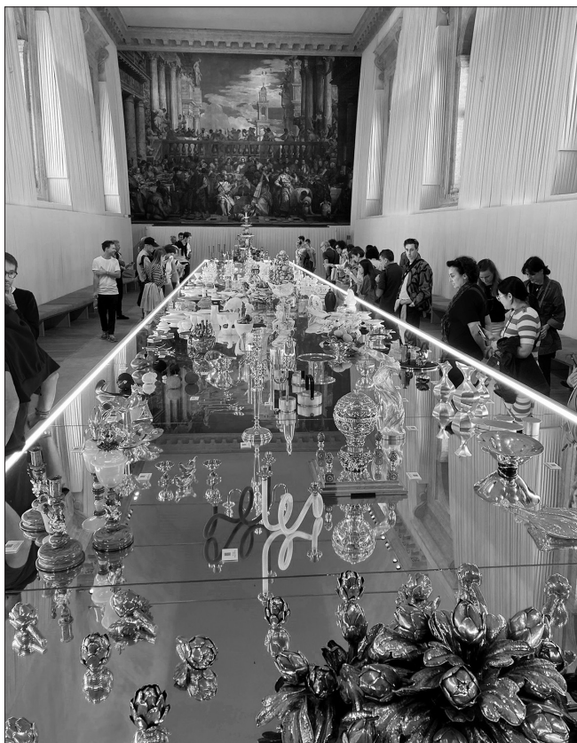
Bienale Homo faber 2024 v Benetkah (foto: Tanja Roženberger, september 2024).

ne. Pod imenom Homo faber , ‚delujoči človek‘, z bienalnimi razstavami, štipendijami, usposabljanji, ki jih izvaja v Benetkah, podpira rokodelce in kreativne oblikovalce ter si prizadeva za njihovo kulturno, ekonomsko in družbeno prepoznavnost in uporabnost. Bienale Homo faber 2024 je s pomenljivo naslovno temo Potovanje življenja ( The Journey of Life ) pripravil pravo praznovanje globalne izkušnje sodobnega rokodelstva, 5 razstave na njem pa so omogočale čutna doživetja, prikaze in vključevanje obiskovalcev. Pomembno je, da so bili v ponudbo Bienala vključeni tudi obiski delujočih rokodelskih delavnic v Benetkah; te svojo novo podobo gradijo prav z rokodelstvom.