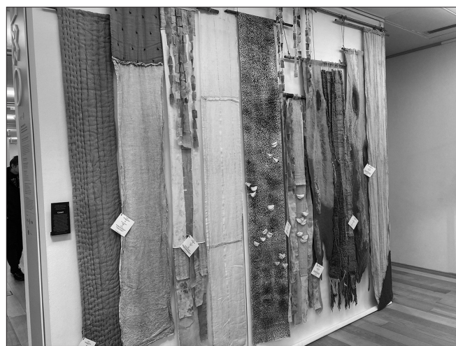
Triennale rokodelstva v Slovenskem etnografskem muzeju (foto: Tanja Roženberger, februar 2024).

novost v razvoju razstave je ponudil leta 2015 uvedeni natečaj za ustvarjanje sodobnih inovativnih izdelkov na temeljih dediščine z naslovom Iz rok do oblike ; tradicionalno rokodelstvo je odprl sodobnim izdelavi, tehniki, materialu ali motivu. V celoti dopolnjeni koncept projekta se je leta 2023 predstavil pod naslovom Triennale rokodelstva . 7 Na natečaju izbrane izdelke je razdelil v tri temeljne skupine: Ohranjene tradicije – mojstrska znanja, spretnosti in veščine; Nove tradicije – prilagoditve rokodelskih simbolik in tehnik; Nova materialnost – konceptualni in socialni pristopi. Izdelki in projekti, predstavljeni na Trienalu rokodelstva , dokazujejo, »da tradicija in rokodelstvo nista toga in nespremenljiva, ampak prožna spodbujevalca novih, inventivnih procesov ročne izdelave (Požar, Roženberger in Vardjan 2023: 13).