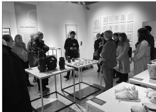
Razstava Triennale rokodelstva je gostovala tudi v Posavskem muzeju Brežice (foto: Tanja Roženberger, september 2023).