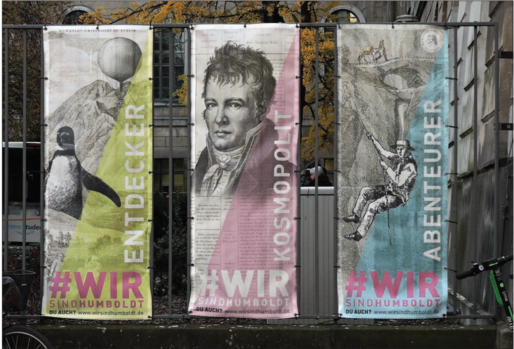
Slika 1: Posvet je potekal na Humboldtovi univerzi v Berlinu, kjer je bilo vse v znamenju »Humboldtovega leta 2019«, posvečenega 250-letnici rojstva Alexandra von Humboldta, ki se je v Berlinu rodil leta 1769.