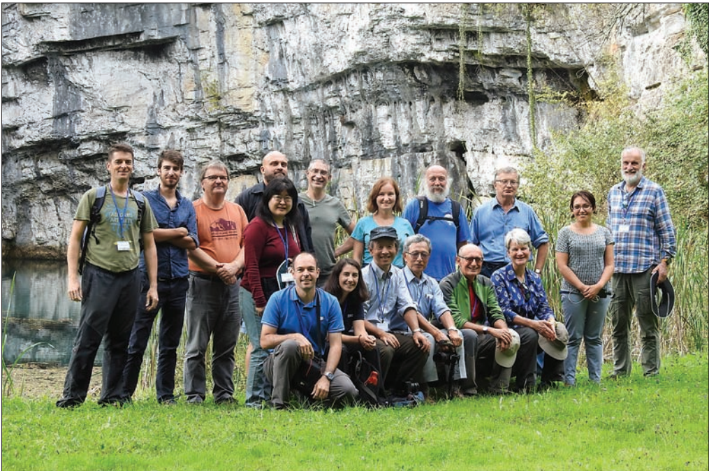
Slika 5: Skupinska fotografija udeleženk in udeležencev pokonferenčne ekskurzije ob izviru Krupe.