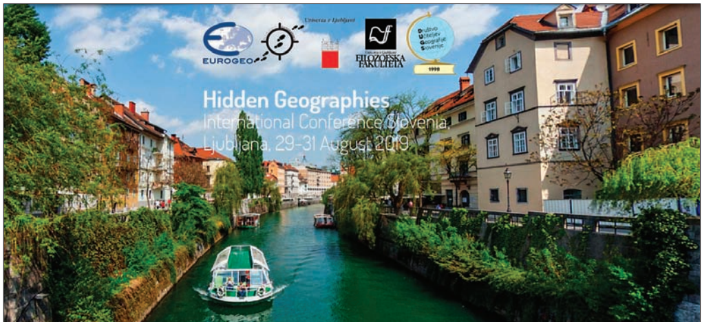
Slika 1: Naslovnica spletne strani mednarodne konferenca »Skrite geografije«.

Pod okriljem Evropske zveze geografov EUROGEO in v sodelovanju z Društvom učiteljev geografije Slovenije, je Oddelek za geografijo Filozofske fakultete Univerze v Ljubljani, ob praznovanju 100-letnice ustanovitve, med 29. in 31. avgustom 2019 organiziral mednarodno konferenco »Skrite geografije« ( Hidden Geographies International Conference Slovenia ; slika 1).