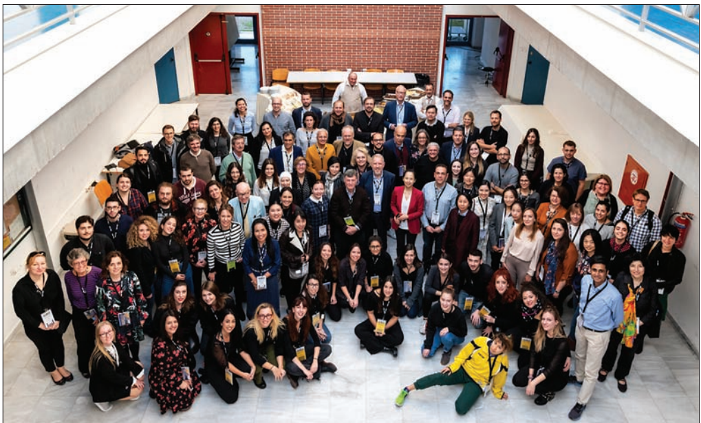
Slika 1: Skupinska slika udeležencev konference.

Mednarodna zveza za znamčenje prostora IPBA pod svojim okriljem na svetovni ravni povezuje raziskovalce, strokovnjake iz marketinških in razvojnih agencij ter druge predstavnike javnih in zasebnih institucij, ki se ukvarjajo z razvojem teritorialnih blagovnih znamk. Tridnevna konferenca, ki je bila letos organizirana četrtič zapored, je bila sestavljena iz različnih tematskih sklopov predavanj in razprav.