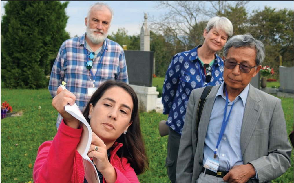
Slika 4: Razlagam o spremembi rabe tal v Bojancih je pozorno prisluhnil tudi predsednik Mednarodne geografske zveze, Japonec Yukio Himiyama.