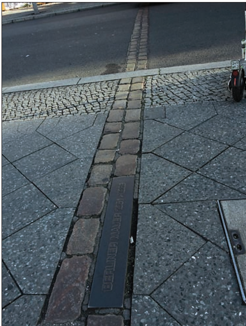
Slika 2: Berlin, kot nekdanj razdeljeno mesto, je že v simbolnem smislu primeren kraj za razprave o mejah. Nekdanja mejna črta med Zahodnim in Vzhodnim Berlinom.