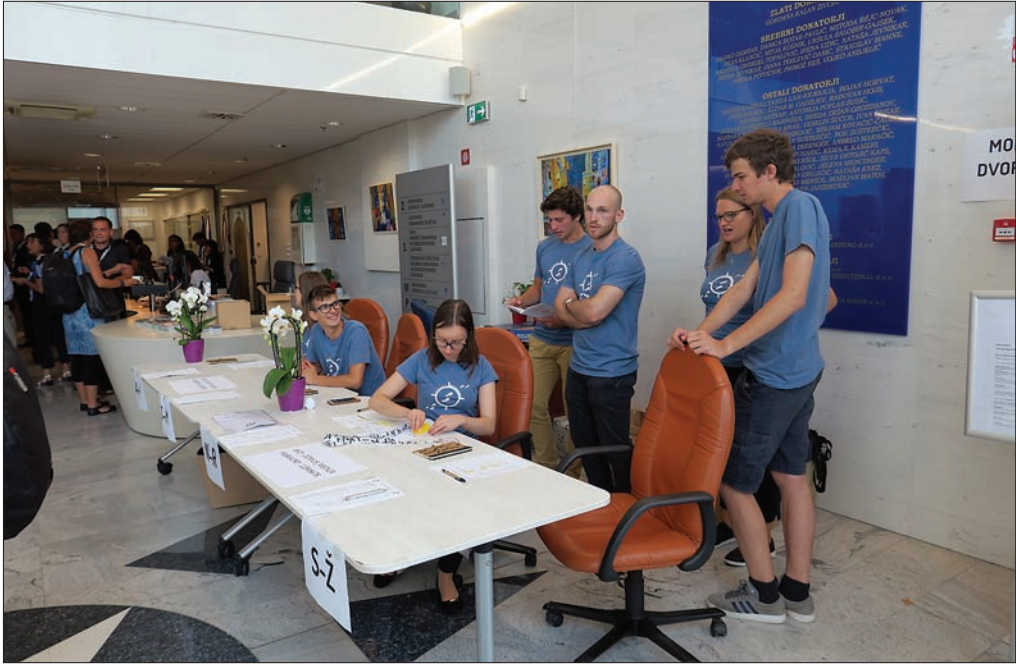
Slika 5: Na mladih geografinjah in geografinjah »geografija stoji«.

Konferenca je izpostavila pogosto spregledano dejstvo, da je večina »geografij« skritih ter ponudila priložnost za razprave o izvorih in učinkih skritih geografij, zavedanju njihovega obstoja, njihovem zaznavanju, razumevanju, razlagi in uporabi v raziskovanju, izobraževanju, odločanju, upravljanju ali v vsakodnevnem življenju. Udeleženci so ugotavljali, da so geografije skrite zato, ker so nam nevidne, namenoma prikrite, še neodkrite, ker jih ne poznamo, ali pa je naše »poznavanje« zaradi spremenljivosti pojava zastarelo. Skrite geografije lahko izredno močno vplivajo na družbene in naravne pojave in procese ter tudi na naša življenja. Potrdila se je izhodiščna teza, da je vloga geografije pri njihovem odkrivanju, namenskem prikrievanju (na primer v primeru varovanja naravnih virov, ranljivih skupin prebivalcev, strateških objektov), prepoznavanju njihovih pomenov, razumevanju, razlagi in predstavljanju izredno pomembna. Izjemen tehnološki razvoj in dostopnost informacij omogočata geografiji, geoinformatiki, kartografiji in drugim vedam, ki se ukvarjajo s prostorskimi vidiki naravnih ter družbenih pojavov in procesov, odkrivanje ali vsaj boljše vrednotenje vedno novih, doslej skritih geografij. To pa sproža naraščajoče potrebe po ustrezni izbiri, razlagi in povezavi novega z obstoječim znanjem, pri čemer ima geografsko izobraževanje neprecenljivo vlogo.