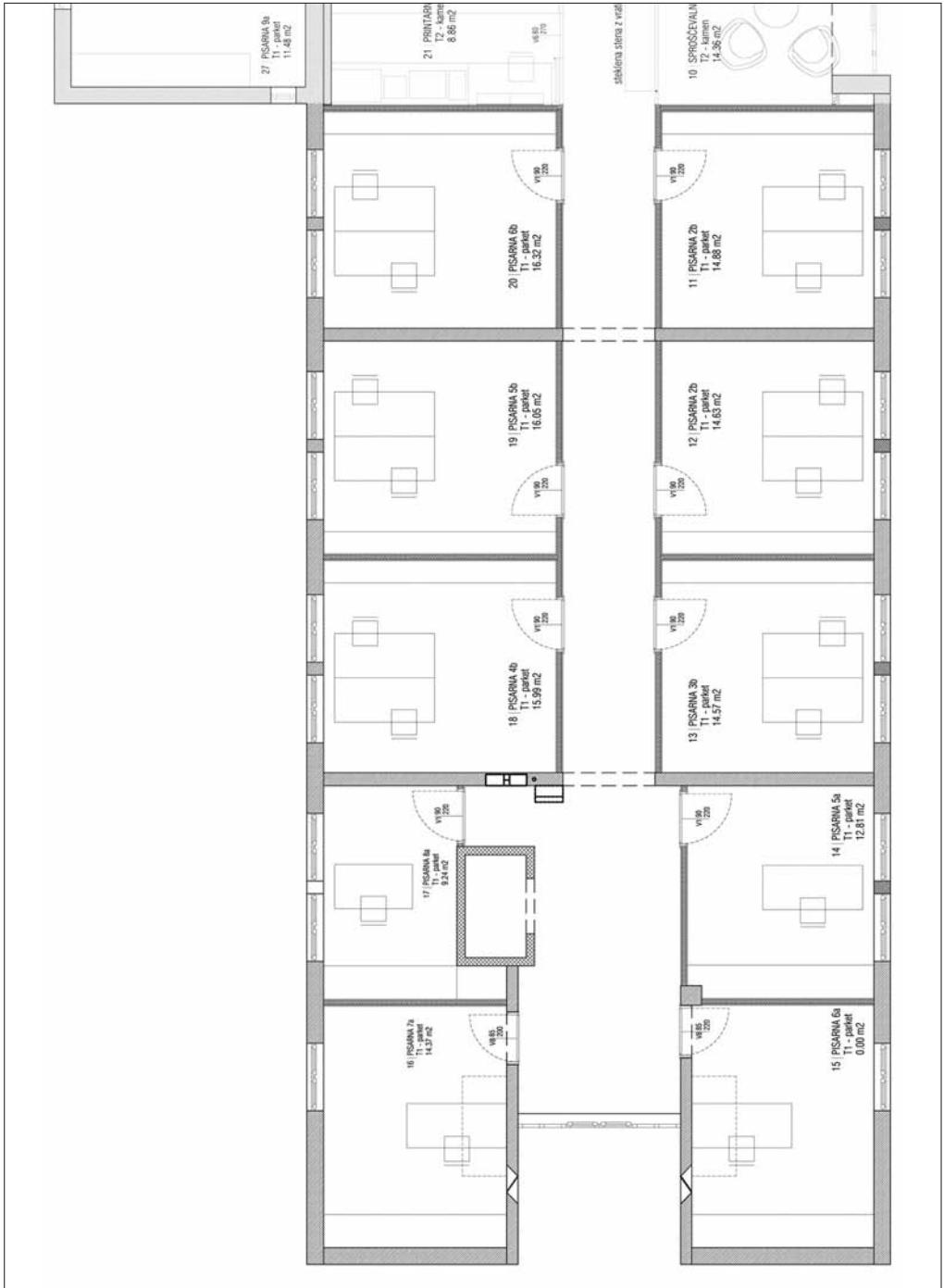
Slika 1: Tloris zahodnega dela z dvigalom.