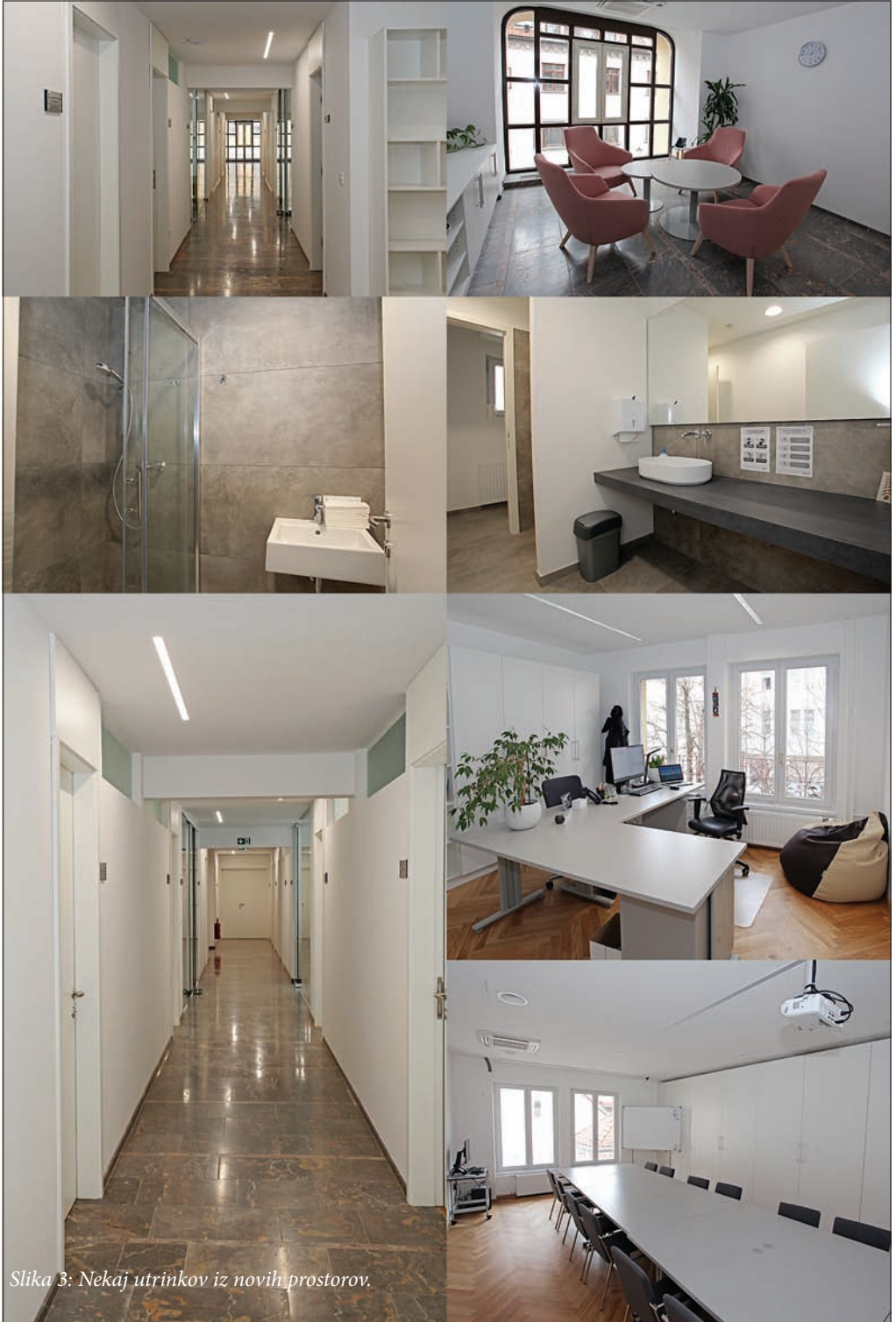
Slika 3: Nekaj utrinkov iz novih prostorov.