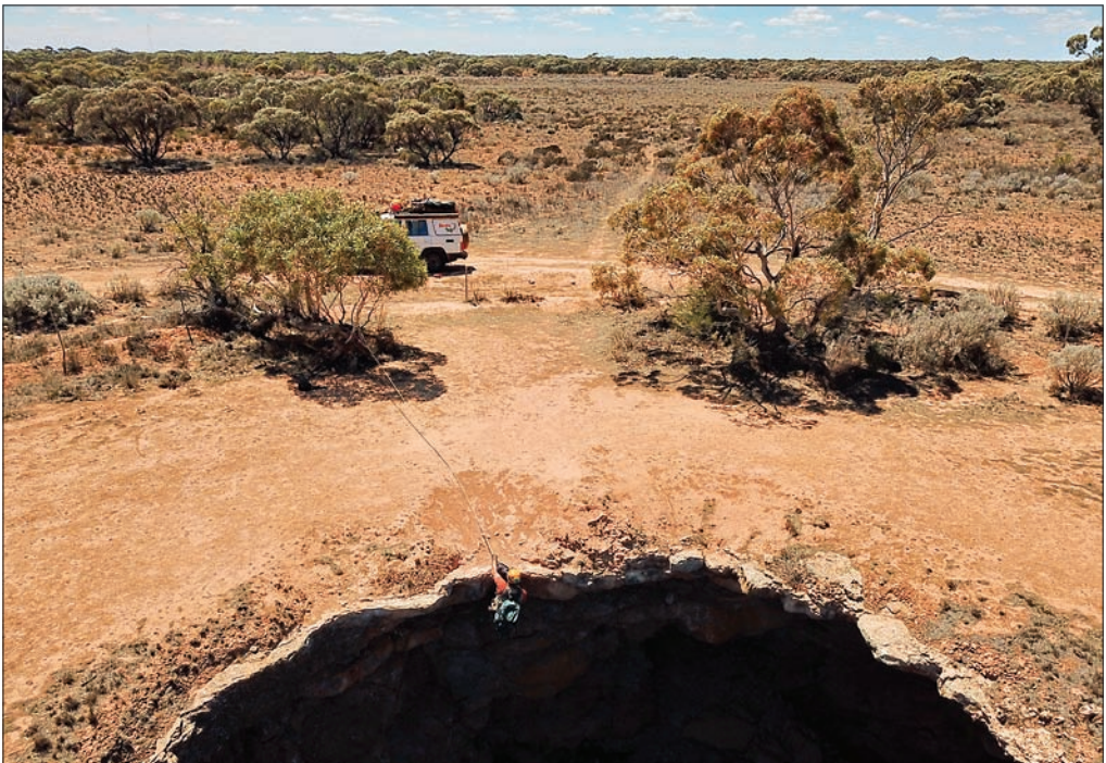
Slika 3: Inštitutske raziskave potekajo tudi na drugi celinah – preučevanje planote Nullarbor v Avstraliji.