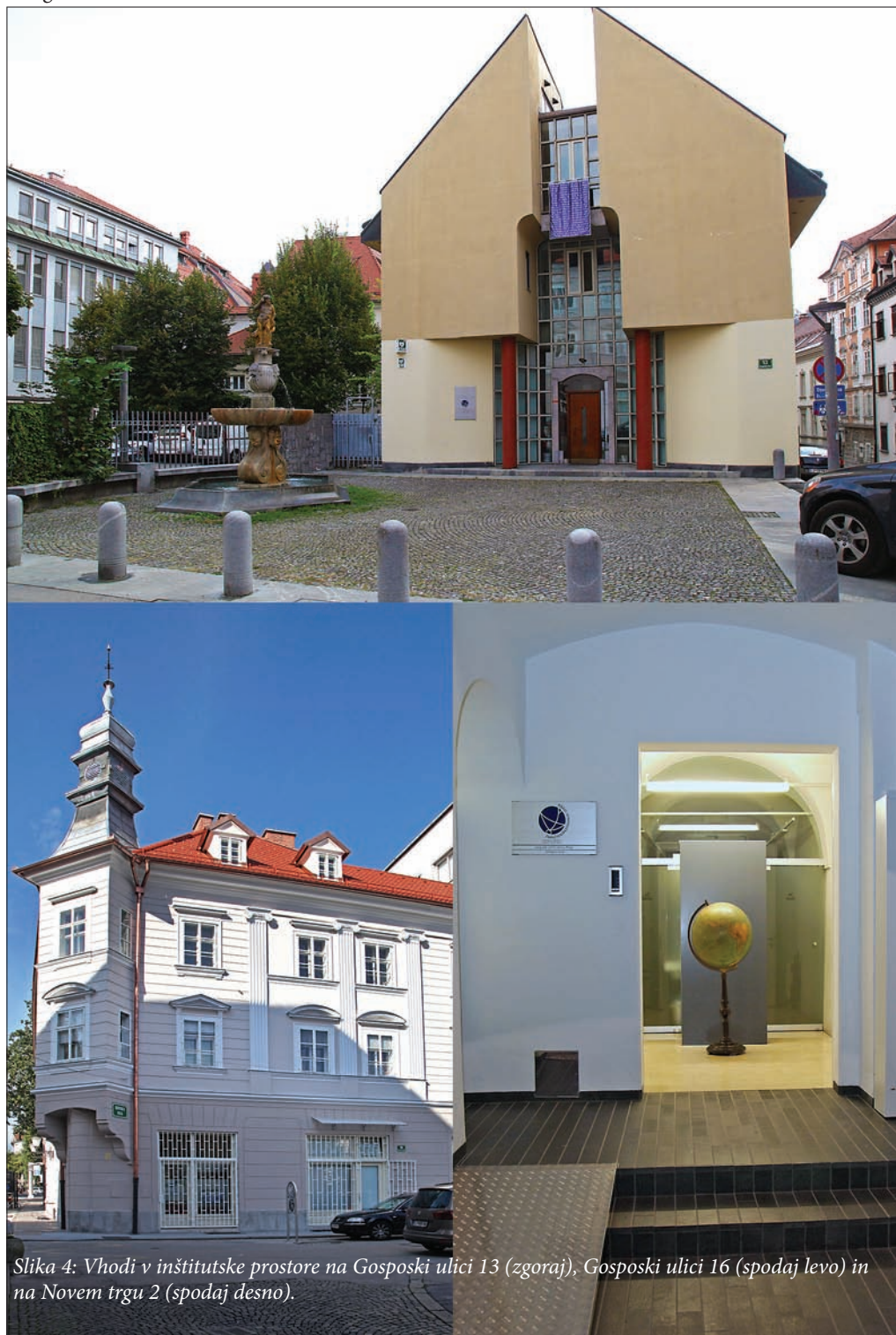
Slika 4: Vhodi v inštitutske prostore na Gosposki ulici 13 (zgoraj), Gosposki ulici 16 (spodaj levo) in na Novem trgu 2 (spodaj desno).