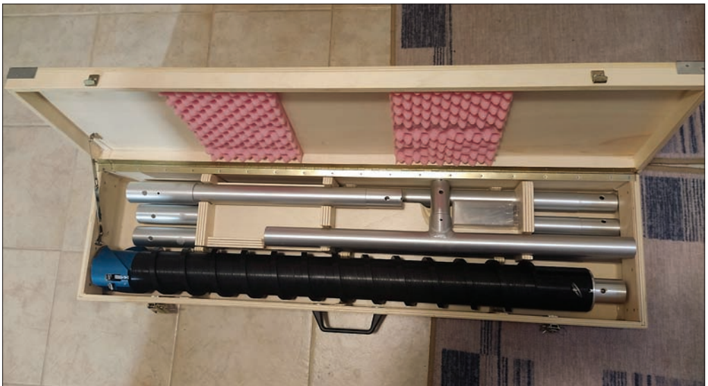
MANCA VOLK BAHUJN