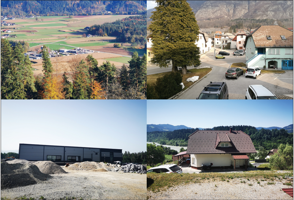
Slika 3: Primeri fotografij stavb, ki sodijo v različne kategorije v preglednici 2: a) kategorija 1: nov industrijski objekt v središču fotografije – fotografijo lahko orientiramo in uporabimo za izmero (fotografija: Natalija Novak), b) kategorija 1: fotografijo lahko orientiramo in dobimo lokacijo porušene stavbe na mestu, kjer so v središču fotografije trije avtomobili (fotografija: Vasja Bric), c) kategorija 3: isti industrijski objekt kot na sliki a – fotografije ne moremo orientirati (fotografija: Natalija Novak) in d) kategorija 4: fotografija je neuporabna, ker prikazuje samo novo fasado na stavbi (fotografija: Natalija Novak).