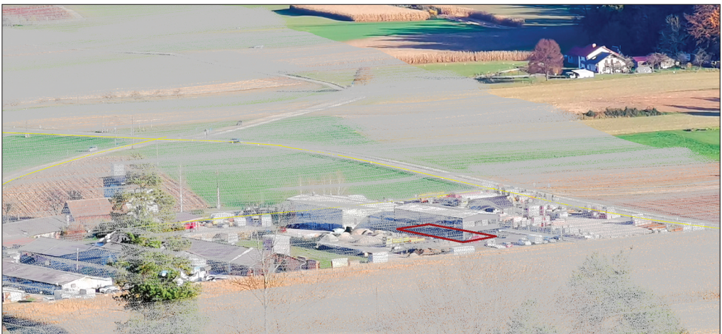
Slika 4: Zajem novega objekta z interaktivno orientacijo: sive točke predstavljajo projiciran DMR, rumene črte so vektorji cest, rdeča črta je obod nove stavbe.