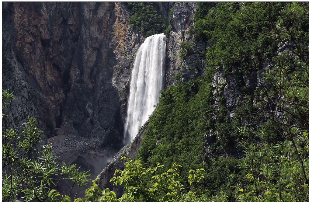
Slika 1: Neokrnjena gorska narava v Posočju je privlačna za številne turiste – slap Boka.