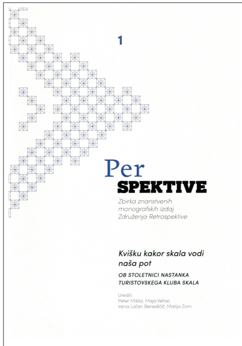
Slika 3: Referati s posvetovanja so objavljeni v posebni monografiji, ki jo je souredil podpisani.