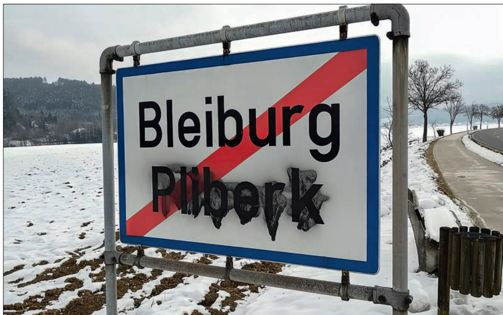
ALJOŠA VRHOVNIK (RTV SLO)