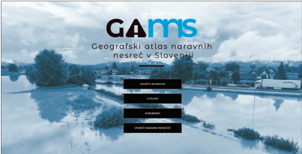
Slika: Uvodna stran Geografskega atlasa naravnih nesreč v Sloveniji.

Odlična odločitev avtorjev atlasa je bila, da so zbranim podatkom o preteklih naravnih nesrečah, kar je že samo po sebi obsežno delo z veliko geografsko in zgodovinsko vrednostjo, dodali še vrsto obstoječih in za tematiko relevantnih zemljevidov oziroma evidenc, tudi drugih raziskovalnih ali upravnih ustanov (na primer zemljevid potresne nevarnosti, zemljevid poplavnih nevarnosti, lavinski kataster, zemljevid nevarnosti proženja zemeljskih plazov, lokacije gozdnih požarov). Ker je atlas objavljen v elektronski obliki, je možno vse te različne informacijske plasti poljubno kombinirati, kar daje spletnemu atlasu pomembno prednost pred klasično knjižno izdajo. Tudi obsežen opis/tolmač atlasa je izdelan strokovno korektno ter omogoča tudi nestrokovnjaku pravilno interpretacijo posamičnih plasti in celotne vsebine atlasa.