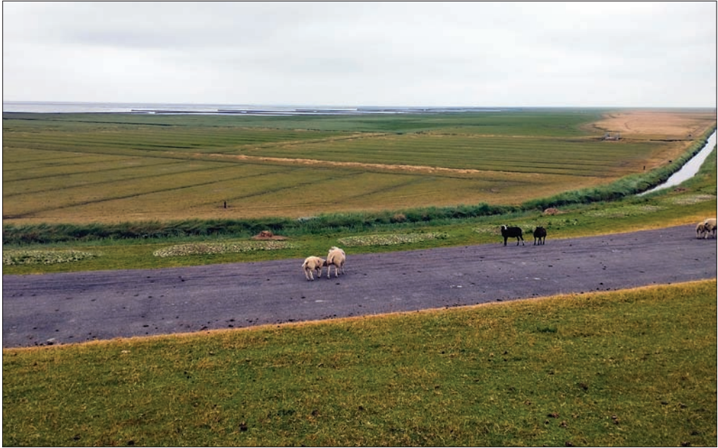
Slika 2: Polder – ozemlje, ki so ga z izsuševanjem na Nizozemskem »vzeli« morju.

obrobje mesta Groningen, peta pa je udeležencem približala proces digitalizacije na nizozemskem podeželju.