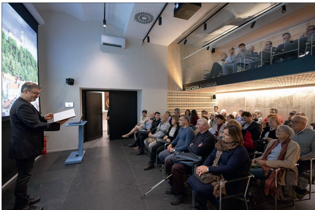
Slika 2: Praznovanje 40. obletnice društva v prenovljeni Gosposki in Križevniški dvorani Zemljepisnega muzeja GIAM ZRC SAZU.