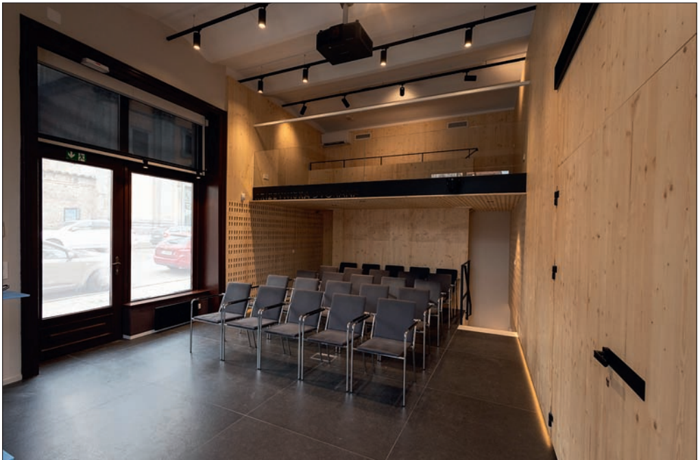
Slika 4: Prenovljena Križevniška dvorana novembra 2024.