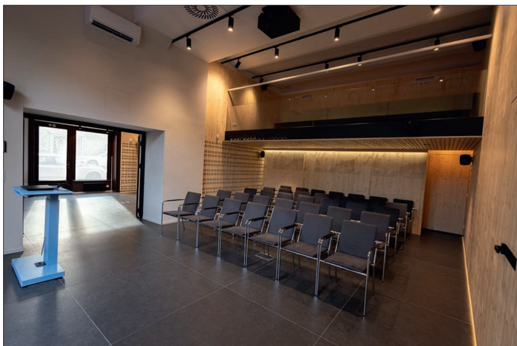
Slika 7: Prenovljena Gosposka dvorana novembra 2024.