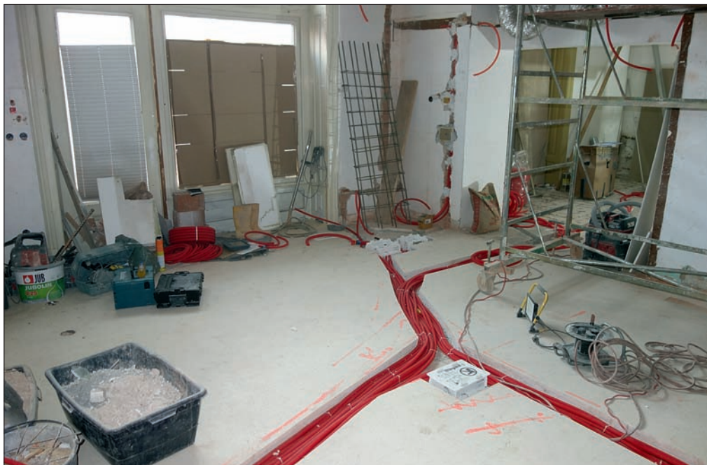
Slika 2: Obnovitvena dela v Gosposki dvorani januarja 2024.