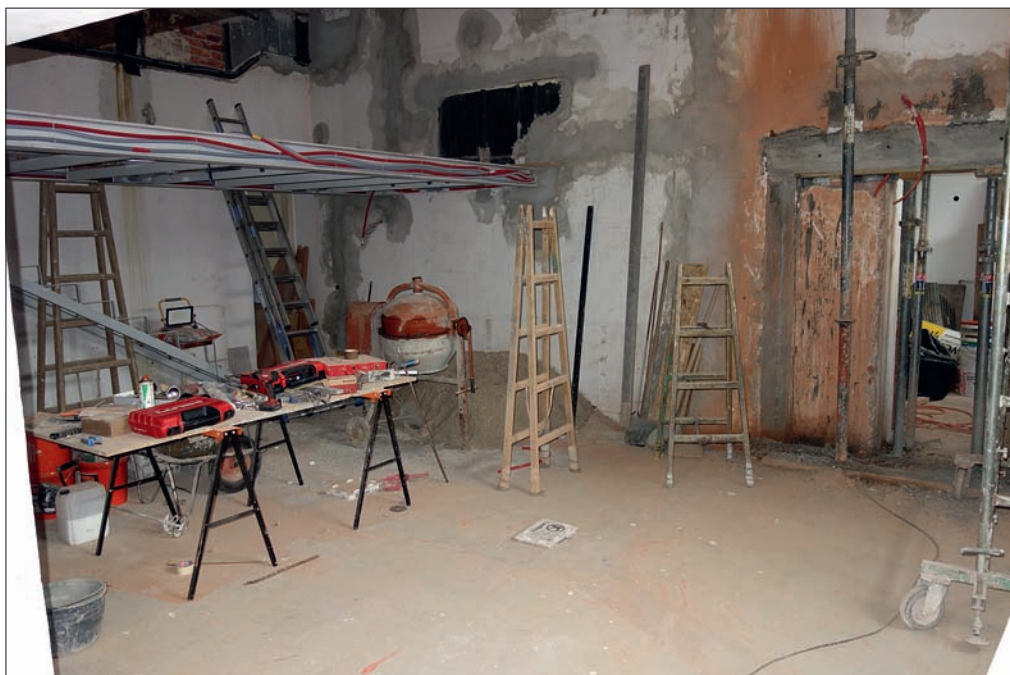
Slika 3: Obnovitvena dela v Gosposki dvorani januarja 2024.