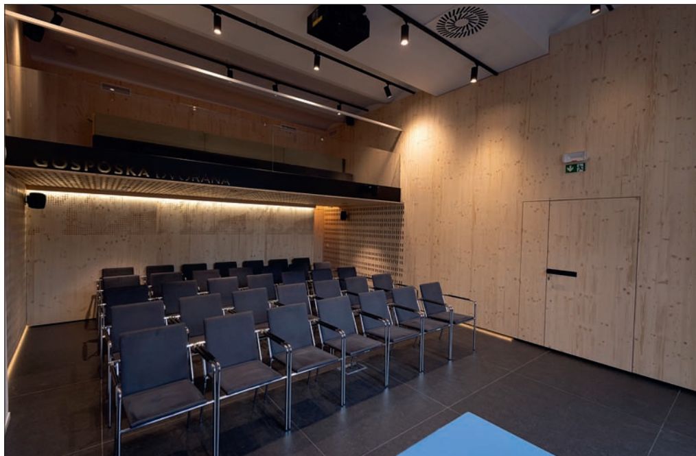
Slika 6: Prenovljena Gosposka dvorana novembra 2024.