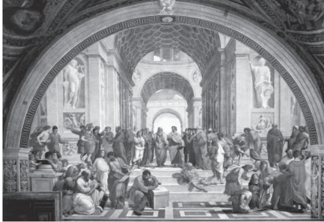
Slika 5: Rafael, Atenska šola , 1509, Stanza della Segnatura, Palazzi Pontifici, Vatikan.

Rafael med starimi mojstri slovi po oblikovanju draperije. Človeške figure na njegovih slikah ne stojijo pred nami kot prazne vreče, ampak se skozi draperijo, skozi oblačila, skozi gubanje oblačil kaže anatomija njihovih teles. Na sloviti Rafaelovi sliki Atenska šola s Platonom in Aristotelom v središču (slika 5) je pri moški figuri desno spodaj, ki nam je najbližje in je s hrbtom obrnjena proti nam, pod oblačilom jasno vidna okončina (slika 6). Še več: vidna je celo oblika meč.