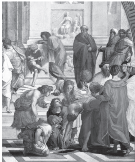
Slika 6: detajl z Atenske šole .