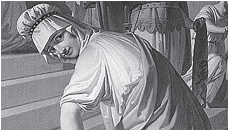
Slika 11: detajl s Salomonove sodbe .

Kavčič je sliko Salomonova sodba naredil po zmagi koalicije evropskih držav, Avstrije, Velike Britanije, Prusije in Rusije, nad Napoleonom in po dunajskem kongresu, na katerem so zmagovite koalijske sile oblikovale nov evropski politični red. Vendar slika avstrijskemu cesarju, ki je bil njen naročnik, menda ni bila všeč in jo je sprejel šele po posredovanju Kavčičevega mecena. Malo verjetno je, da mu ni ugajala zato, ker jo je gledal, kot bi jo gledal Lessing, z Lessingovimi očmi. Veliko verjetneje je, da ga je na njej zmotila druga ženska (slika 11).