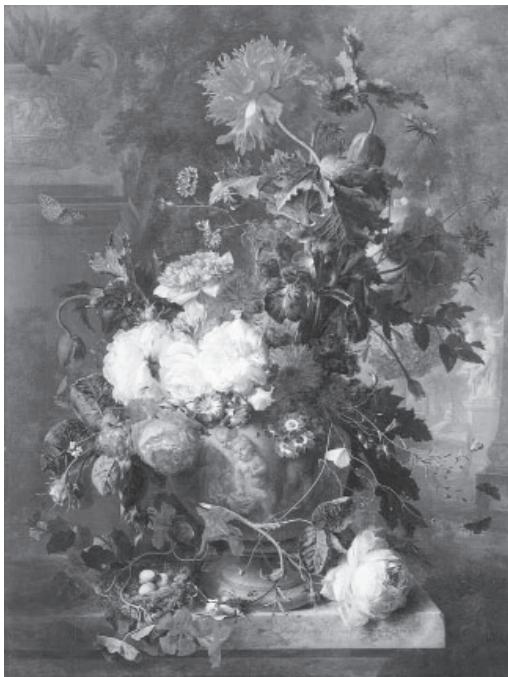
Slika 3: Jan van Huysum, Rože , 1722, Ermitaž, Sankt Peterburg.

Lessing ima prav: kdor rož ni poznal prej, iz Hallerjevega opisa sicer o njih lahko dobi neko predstavo, toda ne zelo jasne. Upravičeno lahko domnevamo, da niti botanik ne bi pri vseh natanko vedel, katere so. Svišča bi še ločil drugega od drugega, ob drugih rožah pa bi bil, če v opombah ne bi bila navedena njihova latinska imena, nemara v zadregi. Haller vsekakor natančno opisuje alpske rože, a se pesniški opis, trdi Lessing, po nazornosti ne more meriti s slikarskim prikazom. Pesniški opis napreduje zaporedoma, po delih, na sliki pa lahko to, kar je prikazano na njej, zajamemo z enim samim pogledom. Hallerjev opis ob sliki rož, ki jo je naredil kak nizozemski mojster, kratko malo zbledi. Lessing se tu spomni in mimogrede omeni Jana van Huysuma (prim. Lessing 127). Dodajam zgled, eno številnih van Huysumovih rožnih slik (slika 3).