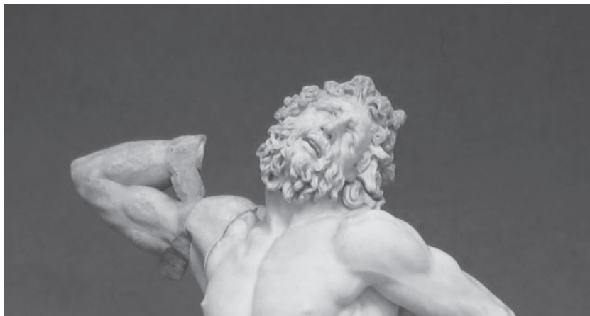
Slika 2: detajl z Laokoontove skupine .

Tri leta pred Lessingovim spisom je veličastno Zgodovino umetnosti starega veka izdal Johann Joachim Winckelmann, utemeljitelj umetnostne zgodovine kot posebne humanistične vede. Toda Laokoonta se je lotil že prej, v Mislih o posnemanju grških del v slikarstvu in kiparski umetnosti , ki so nastale leta 1755. Po Winckelmannovi presoji Laokoont v kiparski upodobitvi ne vpije, drugače kot pri Vergiliju. Soditi, da vpije, trdi Winckelmann, ne dopušča odprtost ust, ki niso na široko odprta in razpognjena v grimaso kot pri vpitju, ampak priprta v vzdih (slika 2). Tako je po njegovem zato, ker sta za grško kiparstvo na splošno značilni edle Einfalt und stille Größe , »plemenita preprostost in spokojna veličina« (Winckelmann 26). Najboljša ponazoritev te formule, ki jo Winckelmann večkrat ponovi in se v poznejšem umetnostnozgodovinskem spisju pogosto citira v izvorniku, pa je prav Laokoont . Čeprav je trojanski svečenik zapleten v smrtni boj s kačama in trpi hudo telesno bolečino, njegov obraz ni divje spačen. Ravno nasprotno: ob telesni bolečini, ki je očitna, in kljub njej obraz namesto krčevite vznemirjenosti duše – to bi namreč pričakovali v paru s telesno bolečino – kaže globok mir.