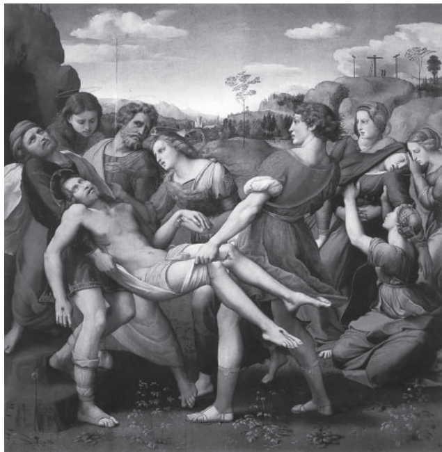
Slika 7: Rafael, Polaganje v grob , 1507, Galleria Borghese, Rim.

A ne le da se skoz draperijo razkriva anatomija. Gube oblačila pri Rafaelu kažejo tudi prejšnji položaj okončin in s tem gibanje oziroma dejanje. Če se namreč oblačilo ne prilega tesno telesu, ampak je ohlapno, tkanina, ko se telo premakne v nov položaj, sicer sledi telesu, vendar se po telesu ne poravna takoj. Za njim pride v novi položaj šele trenutek ali dva pozneje. To se lepo vidi na Rafaelovem Polaganju v grob (slika 7).