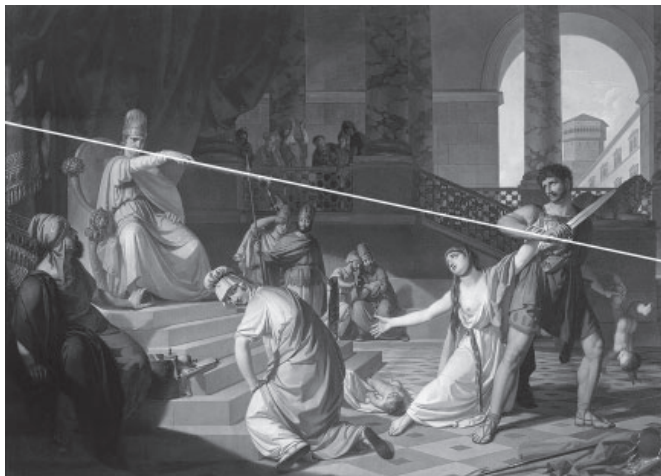
Slika 9: kompozicijski prikaz Salomonove sodbe .

Ta diagonala teče od levo zgoraj in poteka od Salomonovih ust prek njegove roke oziroma dlani, v kateri stiska žezlo, in prek žezla, v katero se podaljšuje njegova ukazovalna kraljevska roka, naprej k desnici, s katero je stražnik že zavihtel meč, medtem ko z levico drži otroka. Vse to – Salomonova usta, njegova dlan, žezlo in stražnikova roka, v kateri je meč, njegova desna podlaket – razen meča je na prvi diagonali. Od desno zgoraj pa teče druga diagonala (slika 10) in poteka od meča v stražnikovi roki k roki tožnice, otrokove prave matere.