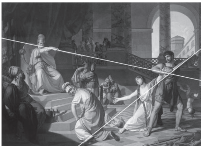
Slika 10: drugi kompozicijski prikaz Salomonove sodbe .

Ta diagonala teče od levo zgoraj in poteka od Salomonovih ust prek njegove roke oziroma dlani, v kateri stiska žezlo, in prek žezla, v katero se podaljšuje njegova ukazovalna kraljevska roka, naprej k desnici, s katero je stražnik že zavihtel meč, medtem ko z levico drži otroka. Vse to – Salomonova usta, njegova dlan, žezlo in stražnikova roka, v kateri je meč, njegova desna podlaket – razen meča je na prvi diagonali. Od desno zgoraj pa teče druga diagonala (slika 10) in poteka od meča v stražnikovi roki k roki tožnice, otrokove prave matere.