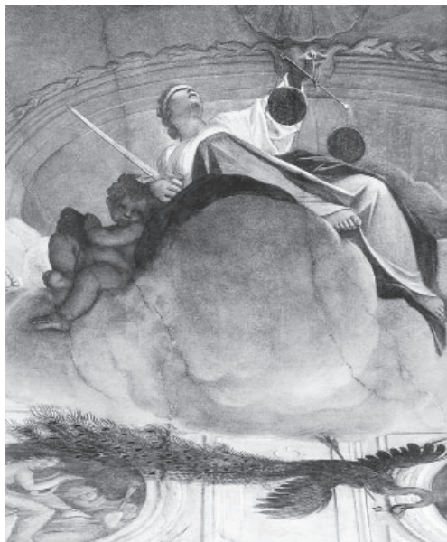
Slika 4: Louis Dorigny, freska, 1701–1711, Palazzo Repeta, Vicenza.

Prav tako kot do opisne poezije narave je Lessing kritičen tudi do alegoričnega slikarstva – kritičen je do obeh zvrsti, ki sta se razmahnili, ena v pesništvu, druga v slikarstvu, v njegovem času. Za alegorično slikarstvo je značilno, da upodobljenim človeškim figuram dodaja atribute, ker brez njih ne bi mogli vedeti, koga te figure sploh predstavljajo. Za zgled jemljem fresko iz palače v Vicenzi (slika 4).