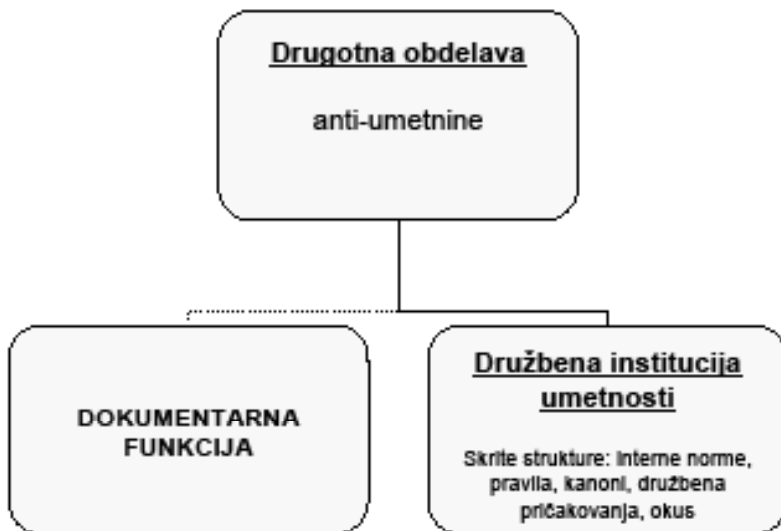
Shema 2: Umetnostni postopek v moderni umetnosti

Če se ponovno ozremo na shemo 1, je prihod tehnološke reprodukcije spremenil odnose med ravnimi umetnostnega posnemanja. Umetnost je zgubila stik z neposrednim materialom in s tem monopol nad reprezentacijo resničnosti, ko ni bila več edina, ki lahko zagotovi večni spomin osebam in stvarjem, ki jih prikazuje, niti ne najnatančnejša. Umetnostni postopek kot drugotna obdelava zato odtlej vzpostavlja odnos le do svojih pogojev možnosti, si zastavlja vprašanja obstoja umetnosti, družbenih pričakovanj in okusov, vloge umetnosti in oblikovanja kanonov. Če pa se umetnostna praksa omeji na raziskovanje same narave umetnostnih praks in umetnostnih institucij, tedaj lahko moderna umetnost poraja le »anti-umetnine«, dela, ki spodnašajo uveljavljeno družbeno vlogo umetnosti in ji celo odkrito nasprotujejo (shema 2).