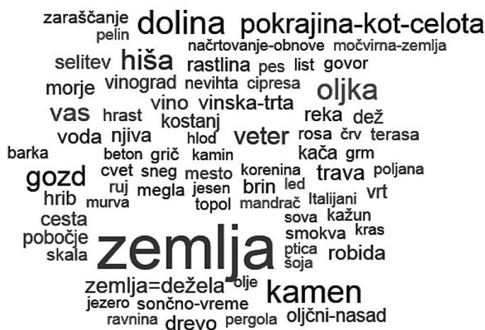
Slika 3: Deskriptorsko polje kodiranih kognitivnih in emocionalnih prvin.

Trde istrske so skale, so stoletjem kljubovale: tudi mi! (Kocjančič, Šavriške 6)