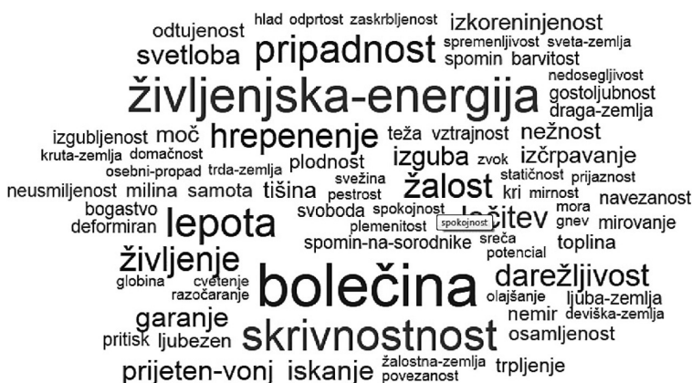
Slika 2: Deskriptorsko polje 5 kodiranih pokrajinskih prvin.