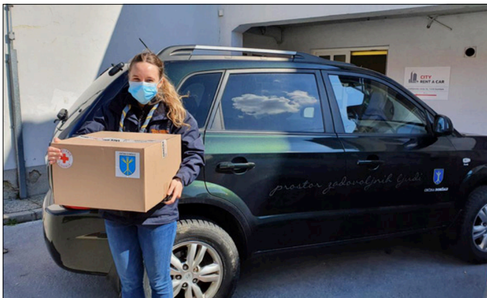
Slika 1: Taborniška prostovoljka na delu v Domžalah

Poleg Ropotarnice na nacionalni ravni velja omeniti tudi številne dobre prakse taborniških društev po Sloveniji, ki so na podlagi idej taborniških prostovoljcev inovativno prilagodila svoj program in tako poskrbela za svoje člane tudi v času, ko je veljalo največ ukrepov za zajezitev epidemije. Delno so rodovi svoja taborniška srečanja preselili na splet, delno pa so izvajali prilagojene oblike taborniških akcij, ki so člane spodbujale h gibanju v naravi, k samostojnemu raziskovanju in izkustvenemu učenju. Rodovi so tako vse leto organizirali različna spletna druženja, orientacije na daljavo, skrivna obdarovanja in podobno. Posebej