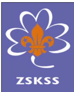
Slika 2: Nekdanji znak ZSKSS

ZSKSS ima sedež v Ljubljani, stegov (lokalnih podružnic) pa je 66 v različnih krajih po Sloveniji. Vsak steg ima vodjo (stegovodja) ter voditelje, ki pripravijo in izvajajo dejavnosti. Člani znotraj ZSKSS oziroma stega so razdeljeni v posamične starostne skupine. Vsaka skupina deluje po programu, ki je prilagojen glede na njihovo starost (Veje, 2016).