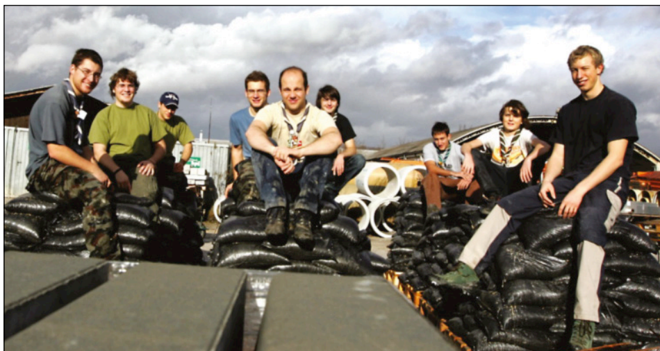
Slika 8: Skavti ob poplavah na božično jutro 2009