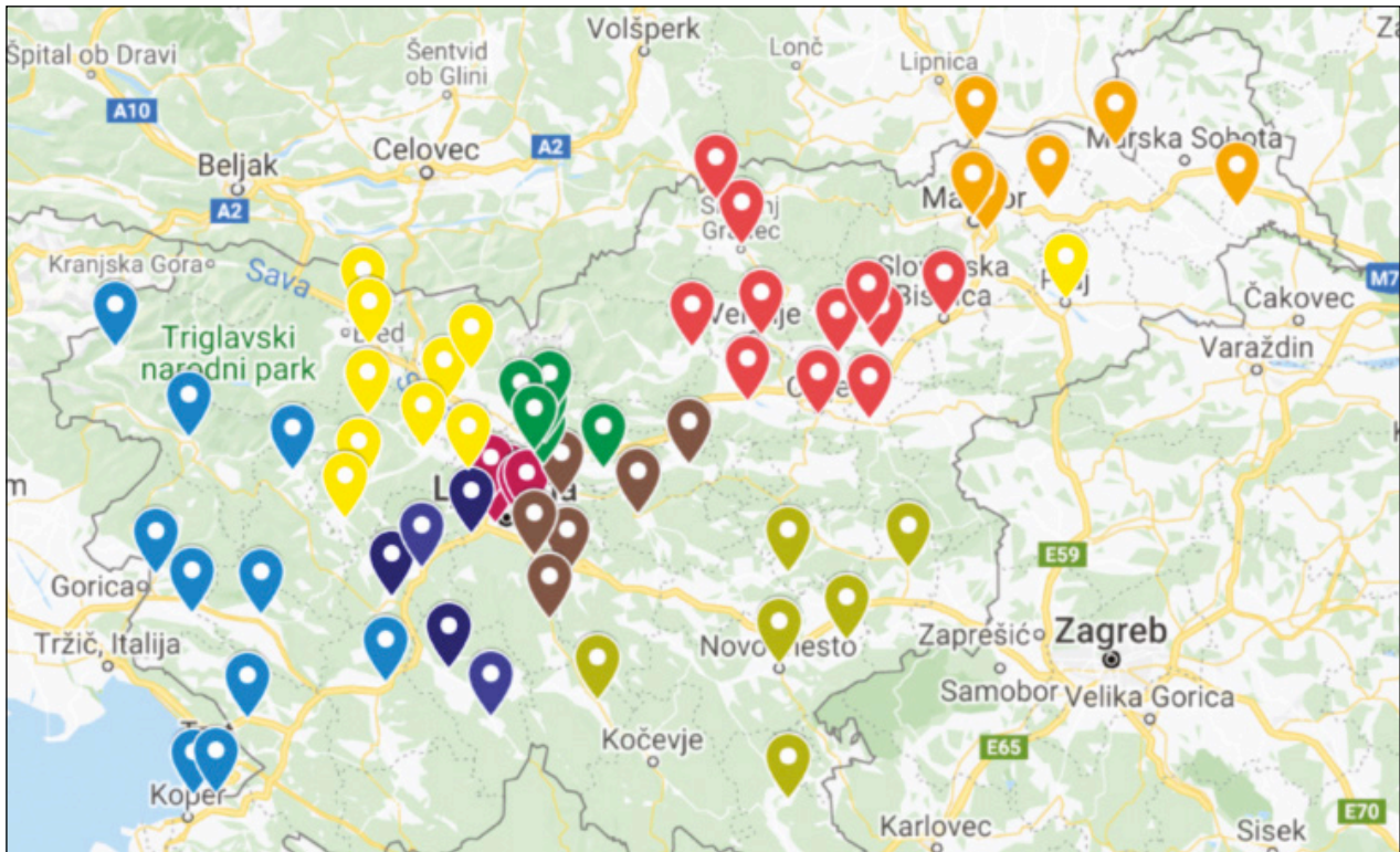
Slika 3: Skavtski stegi (lokalne podružnice) po Sloveniji, združeni v devet ognjišč (barve)