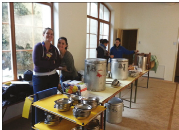
Slika 10: Pomoč v logaškem kriznem centru v domu starejših občanov

Zgodaj spomladi leta 2020 je Slovenijo zajel prvi val koronavirusne bolezni SARS-CoV-2 oziroma covid-19. Posebnost zadnje naravne nesreče je bilo predvsem vprašanje, kako ravnati in pomagati med pandemijo. Glede na to, da ZSKSS nima specifičnega zdravstvenega osebja (imamo sicer bolničarje, ki delujejo v drugih strukturah, ter študente in dijake zdravstvenih ved, ki so bili v odziv že vključeni po »šolski liniji«), smo pomagali predvsem pri logistiki – prevoz opreme in hrane (Državni logistični center Uprave RS za zaščito in reševanje Roje, Črnomelj, Lenart v Slovenskih Goricah, Ljubljana Ježica, Metlika, Škofja Loka). Pozneje smo se vključevali tudi v delo zdravstvenih domov (Maribor, Slovenj Gradec) in domov starejših občanov (Kamnik, Ljubljana Bežigrad, Novo mesto, Postojna, Preddvor). Vse naše dejavnosti je koordinirala štiričlanska skupina skavtov na državni ravni. Med prvim valom covid-19 je sodelovalo 177 prostovoljk in prostovoljcev, ki so opravili 572 ur prostovoljnega dela. Med drugim valom covid-19 je pomagalo 111 prostovoljk in prostovoljcev, ki so opravili 651,3 ure prostovoljnega dela. Skupno je sodelovalo 288 oseb, ki so opravile 1223,5 ure prostovoljnega dela (Letno poročilo, 2020).