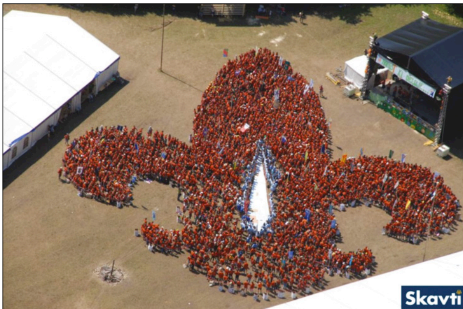
Slika 6: Več kot 3500 skavtinj in skavtov na enem mestu, Jamboree 2008 – Norost, ki deluje

Figure 6: More than 3500 girl guides and boy scouts in one place, Jamboree 2008 – Madness that Works (Norost, ki deluje)