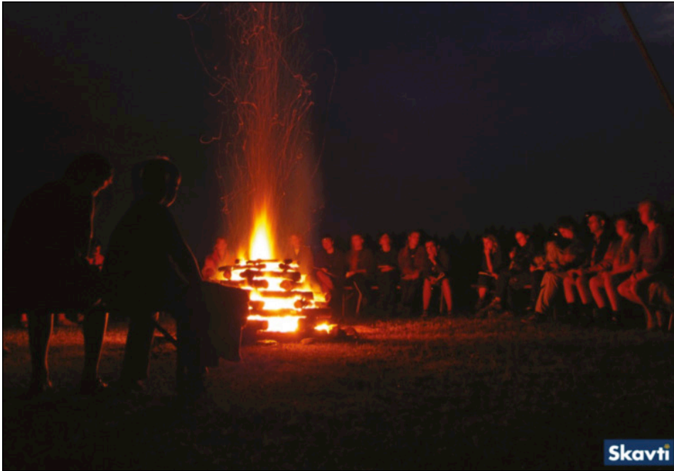
Slika 5: Taborni ogenj