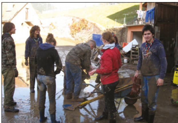
Slika 9: Odpravljanje posledic poplav v Dravogradu leta 2012

Med migrantsko krizo 2015 je ZSKSS pomagalo v državnem logističnem centru na Rojah ter na več lokacijah, kjer so bili vzpostavljeni t. i. nastanitveni in sprejemni centri: Brežice – policijska postaja, Gornja Radgona – sejmišče, Gruškovje – mednarodni mejni prehod, Lendava – skladišče Intereurope, Ljubljana – tri lokacije, Logatec – center vojnih veteranov, Obrežje – železniška postaja, Planinski dom Partizanka, Postojna – center za tujce, Rigonce – mejni prehod, Šentilj – mednarodni mejni prehod, Vrhnika – Vojašnica 26. oktobra. Pomoč