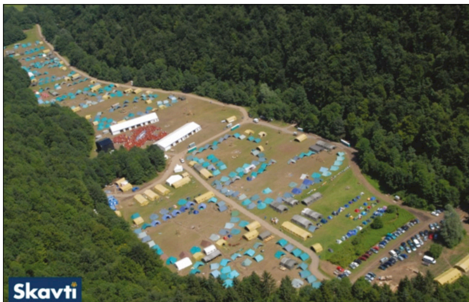
Slika 7: Pogled na taborni prostor 3500 skavtov na taboru Jamboree 2008 pri Podturjaku

4. in 5. novembra 2012 je močno deževje zajelo celotno Slovenijo ter tudi del avstrijske Koroške. Poplave so prizadele širše območje ob strugi reke Drave od Dravograda do Ormoža (Klaneček, 2013). V petih dneh, med 6. novembrom in 10. novembrom, je na terenu delovalo 219 skavtinj in skavtov. Ekipe so delovale na območju občin Dravograd, Duplek, Maribor (v Malečniku), Markovci, Mozirje, Ptuj in Slovenj Gradec. Skupno so opravili 1338 prostovoljnih delovnih ur. Delo je obsegalo predvsem čiščenje blatnih prostorov, odstranjevanje in ločevanje odpadkov, polnjenje protipoplavnih vreč, pomoč gasilcem in prenos vrednejših predmetov na varno. Zaradi velikega števila prostovoljcev, ki so prihajali z različnih koncev Slovenije ter v ekipah do pet oseb, je bil organiziran lasten prevoz z avtomobili. Prav tako je bilo območje delovanja veliko oziroma so bila delovišča razpršena (Novak, 2012). Na podlagi lekcij, ki smo se jih naučili, ter poglobljene analize smo pripravili interna Navodila za ravnanje ekip za postavljanje začasnih prebivališč (2012) ter Grafični postopkovnik delovanja ekip za postavljanje začasnih prebivališč (2012).