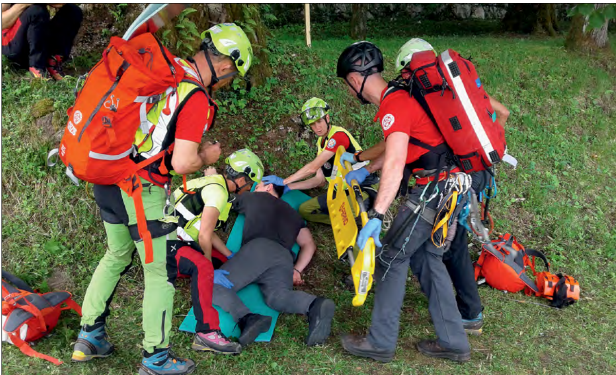
Slika 2: Na tekmovanjih morajo gorski reševalci pokazati veliko mero strokovnega znanja. Figure 2: Mountain rescuers must demonstrate extensive expertise in competitions

Tujci predstavljajo vedno večji problem v naših gorah. In to ne le v visokih, ampak povsod. Njihovo število se iz leta v leto bliskovito povečuje. Prenočitvene zmogljivi-