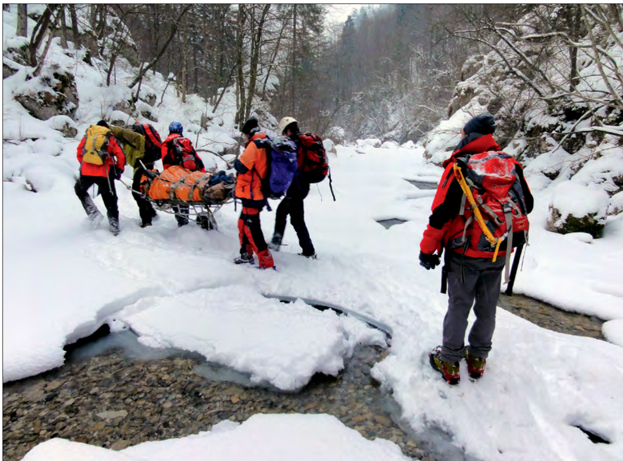
Slika 3. Tudi v sredogorju so razmere za reševanje velikokrat zelo težke. Figure 3: Rescue conditions are often very difficult even in low mountains

vosti predvsem v kočah na področju Triglava so prenatrpane in rezervacije so potrebne že več dni vnaprej. Gneča na poteh proti vrhu Triglava je pa že tako in tako dolgoletna stalnica. Za mnoge so naše gore v primerjavi s tujimi nizke in tako se tudi (ne)pripravijo na vzpone. Ker so prišli od daleč in imajo strogo odmerjen čas, jih tudi slabša vremenska napoved ne odvrne od načrtovanega vzpona. Veliko srečo so imeli madžarski planinci, ki so se kljub neugodni vremenski napovedi (ali pa se sploh niso seznanili z njo) v začetku poletja napotili proti Triglavu. Na Triglavskih podih jih je zajelo poslabšanje s sneženjem in le hitri pomoči mojstranških gorskih reševalcev se lahko zahvalijo, da niso zmrznili. Oblačila so imeli le za lepo vreme.