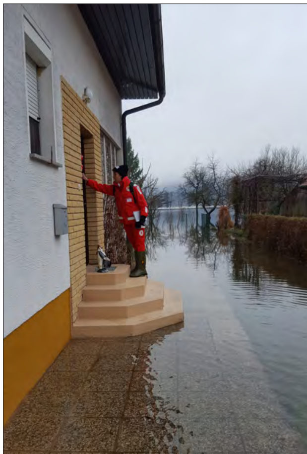
Slika 3: Obisk ene izmed ogroženih hiš na Ljubljanskem barju

Podatki in ugotovitve so poveljniku in štabu CZ Mestne občine Ljubljana koristili za ustrezno odločanje in učinkovito ukrepanje pri vzpostavitvi osnovnih pogojev za življenje. Tako smo prvič ob dejanskem dogodku preizkusili koncept prve psihološke pomoči za prebivalce