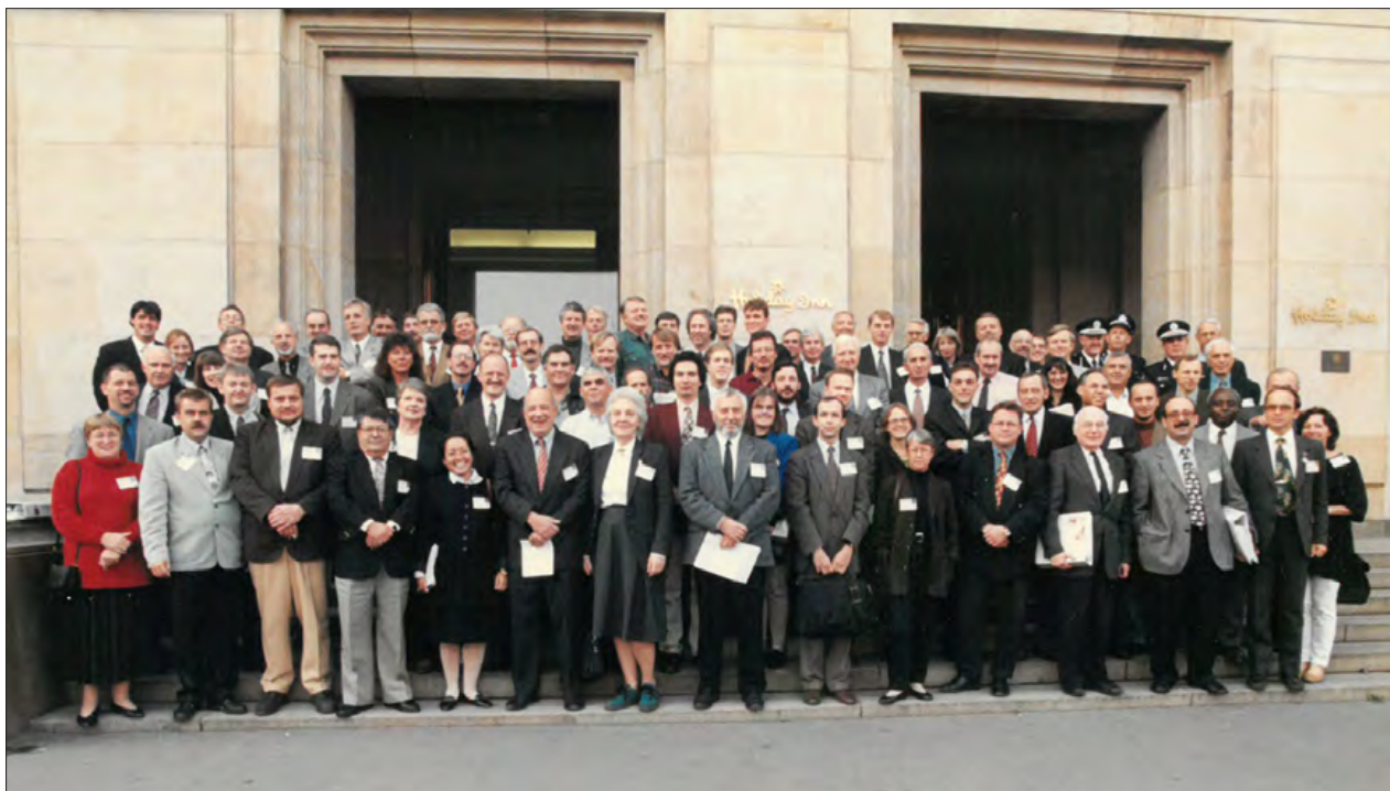
Slika 1: Udeleženci mednarodne konference Okoljski vidiki nesreč [Environmental Aspects of Disasters], Praga, oktober 1997. Prof. Quarantelli stoji v prvi vrsti, tretji z desne, v temnem suknjiču, z belo mapo v desnici.