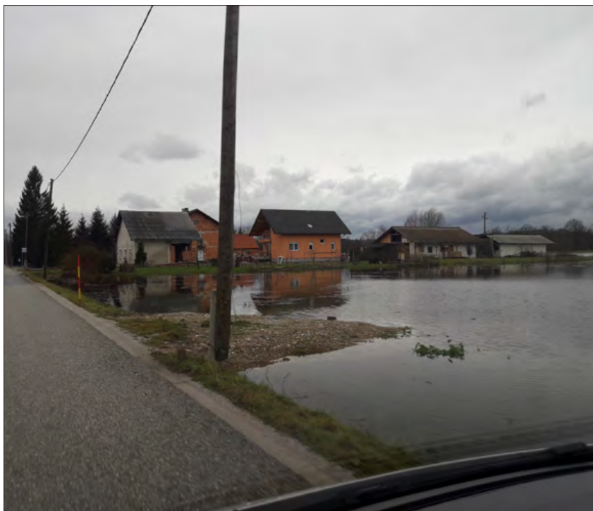
Slika 4: Poplave na območju Črne vasi, MOL, december 2017