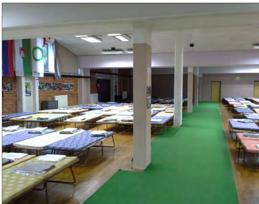
Slika 2: Nastanitveni center Kodeljevo