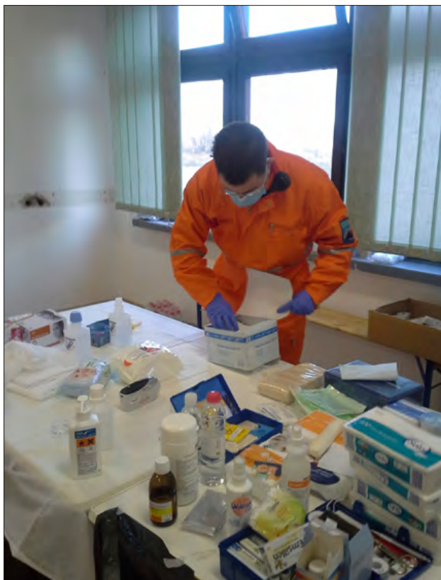
Slika 3: Prva in nujna medicinska pomoč v NC Vrhnika, november 2015