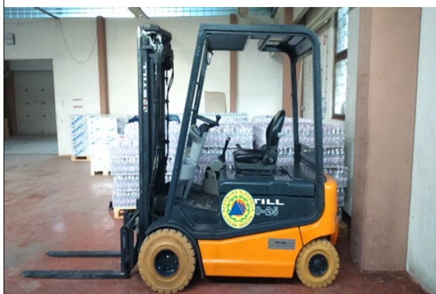
Slika 3: Sprejem mednarodne materialne pomoči v skladišču URSZR Roje in namestitvev v namestitvene centre