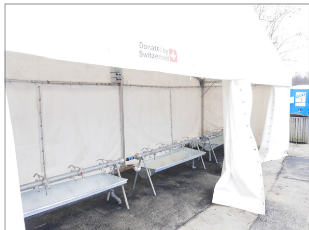
Slika 4: Dvostranska mednarodna pomoč pri ureditvi namestitvenega centra v Šentilju