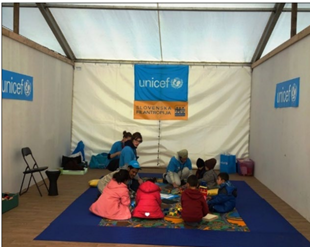
Slika 7: Mednarodna pomoč za ranljive skupine migrantov – otroke