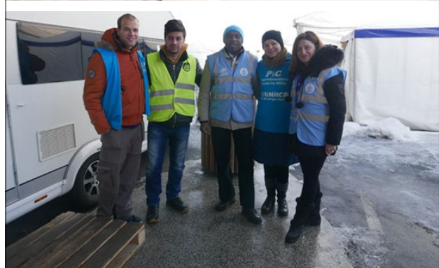
Slika 6: Pomoč UNHCR v materialnih sredstvih in s strokovnjaki