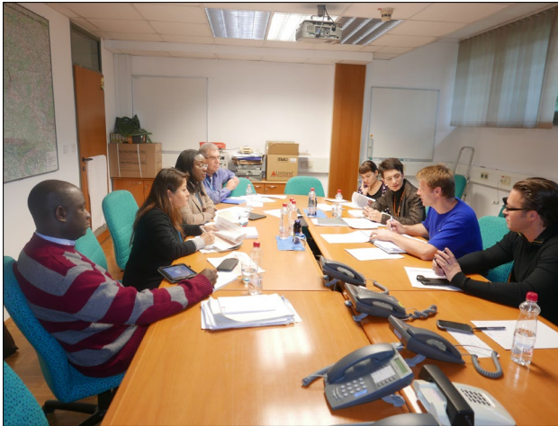
Slika 5: Med celotno migrantsko situacijo so potekali redni usklajevalni sestanki med predstavniki Uprave RS za zaščito in reševanje ter UNHCR