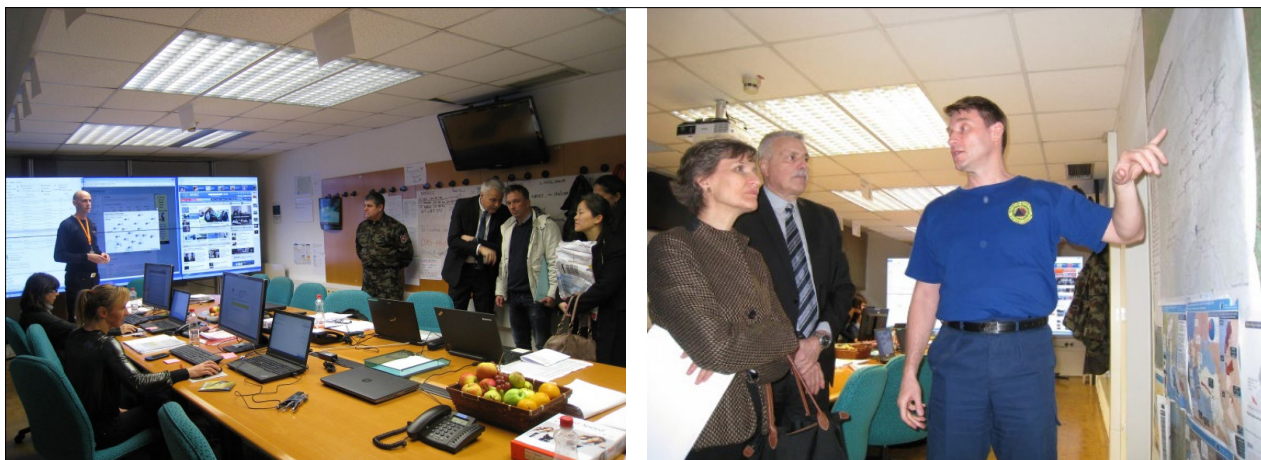
Slika 9: Obisk predstavnikov mednarodnih organizacij v Skupini za podporo Štabu Civilne zaščite RS v Ljubljani