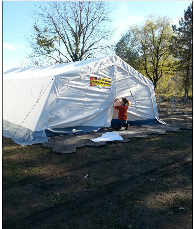
Slika 8: Pomoč tujih humanitarnih organizacij

Pomoč so dale tudi številne tuje mednarodne organizacije, katerih delo so usklajevale ali se z njimi povezovali uveljavljene domače organizacije, predvsem Rdeči križ Slovenije, Slovenska karitas, Adra, EHO podpornica. Nekatere organizacije so se obračale tudi neposredno na Upravo RS za zaščito in reševanje, ki je nato njihovo delo usklajevala z domačimi humanitarnimi organizacijami in platformo Slovenska filantropija. Med tujimi organizacijami, ki so ponudile pomoč, naj navedemo (nekateri organizacije so bile prisotne le kakšen dan ob največjem valu in niso evidentirane): Freunde der Erziehungskunst (pomoč otrokom in mladostnikom v kriznih razmerah), Malteški viteški red (topli napitki za migrante