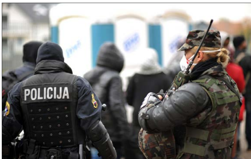
Slika 9: Sodelovanje Policije in Slovenske vojske Figure 9: Cooperation of the Police and the Slovenian Armed Forces

zagotavljanje humanitarne pomoči uspešno. Migranti in begunci ozemlja Republike Slovenije niso neorganizirano in nenadzorovano prehajali, za vse je bilo tudi poskrbljeno, tako da so jim bile zagotovljene osnovne življenjske razmere ter humanitarna pomoč.