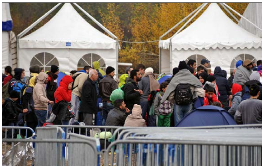
Slika 3: Prihod migrantov Figure 3: Arrival of migrants

Ob izvajanju nalog, povezanih z migranti, se je sistem zaščite in reševanja soočal z razmerami, ki so delno primerljive razmeram ob velikih naravnih in drugih nesrečah. Predvsem je njihova značilnost, da je po pojavu dogodka čas za načrtovanje vseh nujnih ukrepov in njihovo izvedbo omejen in da je stopnja obremenjenosti ter stresa med odločevalci in izvajalci povečana, ker morajo sprejemati odločitve v negotovih razmerah, v katerih dogodki prehitevajo drug drugega. Razlike pa so se pokazale predvsem v delno nejasni vlogi vseh deležnikov, v medsebojnem usklajevanju in njihovi komunikaciji, kar je posledica systemske (normativne, organizacijske, komunikacijske, finančne ipd.) neurejenosti širšega nacionalnovarnostnega sistema in njegove nepripravljenosti na nove grožnje, med katere prav gotovo spada migrantska problematika. Ne nazadnje je takšna systemska neurejenost posledica neskladij v tako imenovanem kriznem upravljanju v Sloveniji, ki je bilo v preteklosti deležno akademske (glej Prezelj v Ujma, 2005: 190–195; Malešič, 2004), ne pa tudi širše javne in strokovne obravnave ter dodatne systemske opredelitve, ob hkratni utrditvi in izboljšanju sedanjega sistema in delujočih podsistemov nacionalne varnosti. Dodaten stresor in hkrati dodatna razlika med delovanjem ob nesreči in v migrantskih razmerah je bila navzočnost grožnje temeljnim vrednotam in normam