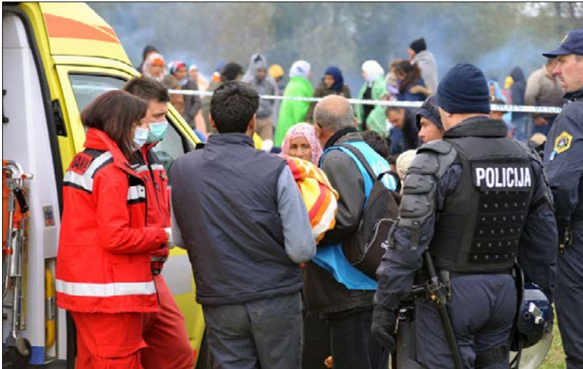
Slika 6: Sodelovanje Policije in zdravstva