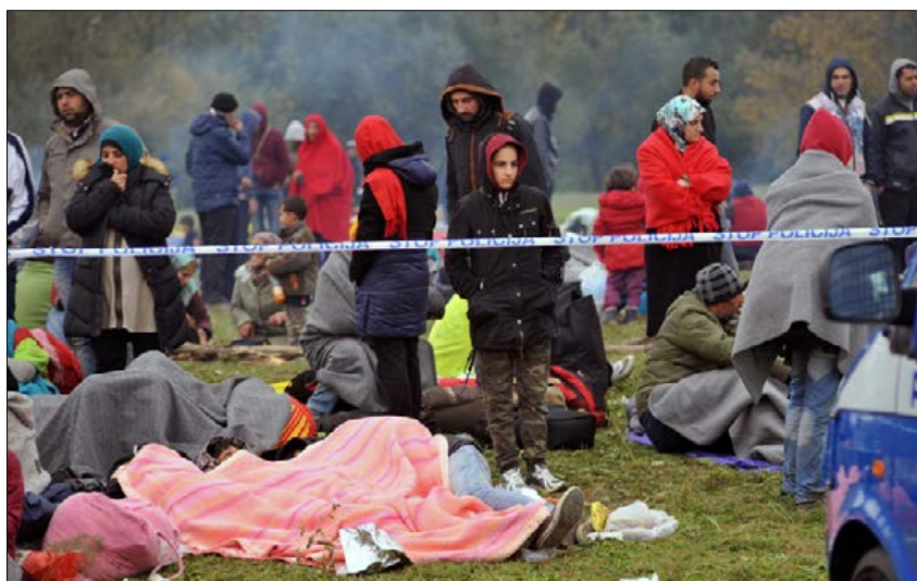
Slika 7: Po prihodu Figure 7: Upon arrival

46.500 oseb (sešteto število angažiranih po posameznih dnevih) iz državnih organov, javnih služb, nevladnih organizacij in javnih del. Analiza aktivnosti je pokazala, da so se ljudje na najodgovornejših mestih v centrih kljub velikemu številu vključenih prepočasi menjali, zato so bili podvrženi prevelikemu stresu.