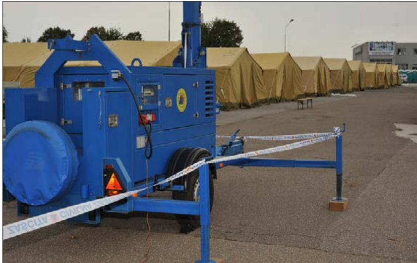
Slika 8: Osvetljeno šotorišče Figure 8: Illuminated camp area