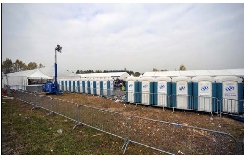
Slika 5: Sanitarni del sprejemnega centra Figure 5: Sanitary facilities at the reception centre

družbenega sistema. Takšne grožnje so del vseh (še tako različnih) definicij krize in so bile kljub organiziranosti pretoka migrantov v Sloveniji prisotne v širši družbi in politiki, nekoliko manj pa tudi med izvajalci pomoči.