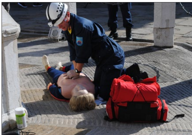
Slika 1: Članice in člani ekip prve pomoči so takoj po prihodu na kraj nesreče začeli dajati prvo pomoč poškodovancem.