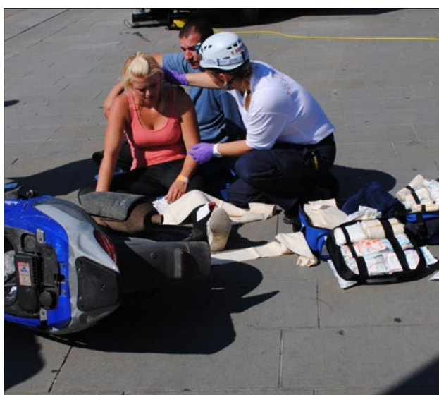
Slika 7: Prva pomoč za udeležence v prometni nesreči