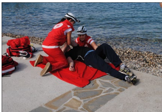
Slika 4: Pomoč človeku, ki se je utapjal v morju.