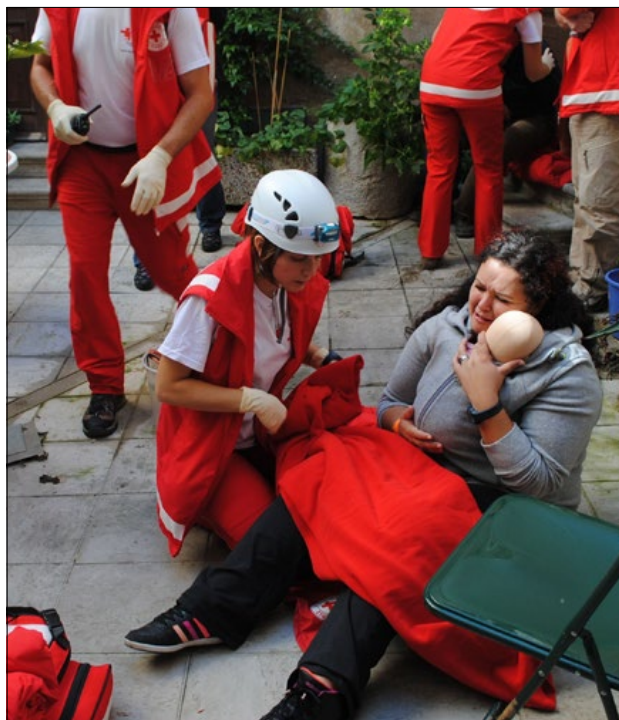
Slika 2: Majhen otrok in njegova mama sta bila poškodovana v neurju.

Temeljno poslanstvo ekip prve pomoči je zagotavljanje neposredne zdravstvene oskrbe oziroma prve pomoči poškodovanim in obolelim v hudih množičnih naravnih ter drugih nesrečah. Kot poudarjajo na Rdečem križu Slovenije, se z usposabljanjem članov ekip večja število oseb, ki so sposobne dajati učinkovito prvo pomoč prebivalcem v kraju, kjer bivajo, delajo ali so v trenutku, ko nekdo potrebuje prvo pomoč. Razvejenost dobro uspo-