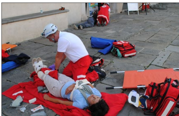
Slika 3: Vodja ekipe prve pomoči je vsakemu članu določil nalogo oziroma kaj mora delati.