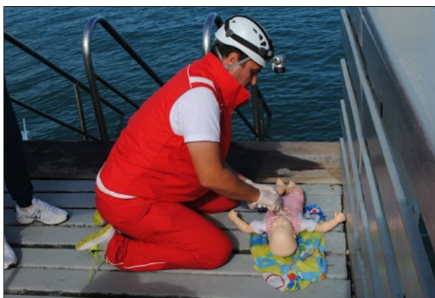
Slika 5: Najtežje je pomagati majhnemu otroku.