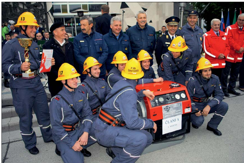
Slika 15: Na tekmovanju gasilskih desetini je v najbolj elitni disciplini – člani A – zmagala ekipa PGD Šentjošt in si prislužila nagrado URSZR – gasilsko brizgalno.

Figure 15: The fire squads' contest (in the most elite category A-team members) was won by the Šentjošt Volunteer Fire-Fighting Society, who earned the ACPDR prize – a fire engine.