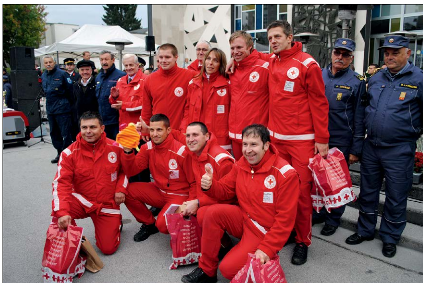
Slika 14: Med ekipami prve pomoči je največ znanja pokazala ekipa MO Slovenj Gradec.

Figure 13: In a technical rescue operation, fire-fighters rescued and provided immediate first aid to a female driver trapped in a vehicle after the collision