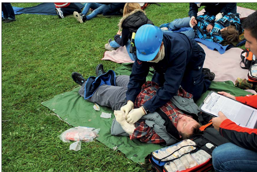
Slika 10: Na množični prireditvi je eksplodirala umazana bomba. Ekipa prve pomoči je morala oskrbeti večje število poškodovanih oseb.