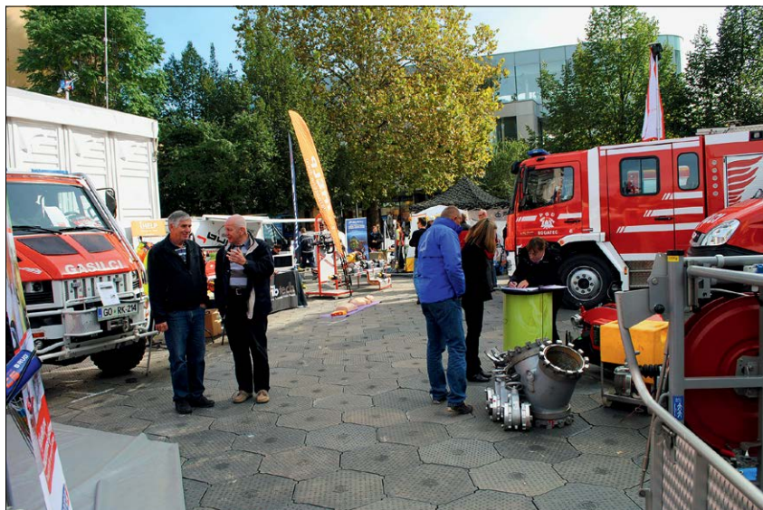
Slika 4: Proizvajalci in zastopniki proizvajalcev so predstavili opremo in tehnična sredstva za reševalce.

Na dnevih zaščite in reševanja je bilo izpostavljeno tudi mednarodno sodelovanje, zato so organizatorji k predstavitvi povabili predstavnike sosednjih Hrvaške in Madžarske ter predstavnike obmejnih regij Furlanije - Julijske krajine iz