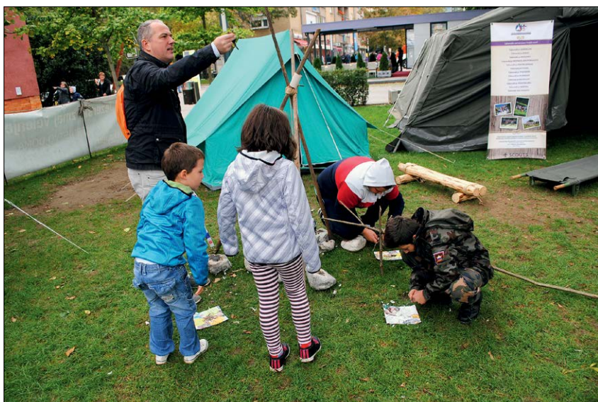
Slika 5: Taborniki in skavti so obiskovalcem prikazali nekaj svojih veščin, ki pomagajo preživeti v naravi. Ena izmed njih je bilo tudi prižiganje ognja s priložnimi sredstvi.

V praktičnem delu vaje so vadbenci izvedli le nekatere dejavnosti, ki so v konceptu odziva ob terorističnem napadu v Državnem načrtu zaščite in reševanja ob uporabi orožij ali sredstev za množično uničevanje v teroristične namene oziroma terorističnem napadu s klasičnimi sredstvi predvidene za takojšnje ukrepanje oziroma