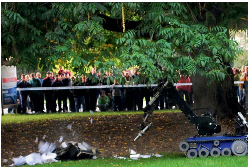
Slika 8: Policisti so sumljiv in zapuščen kovček razstrelili z robotom.