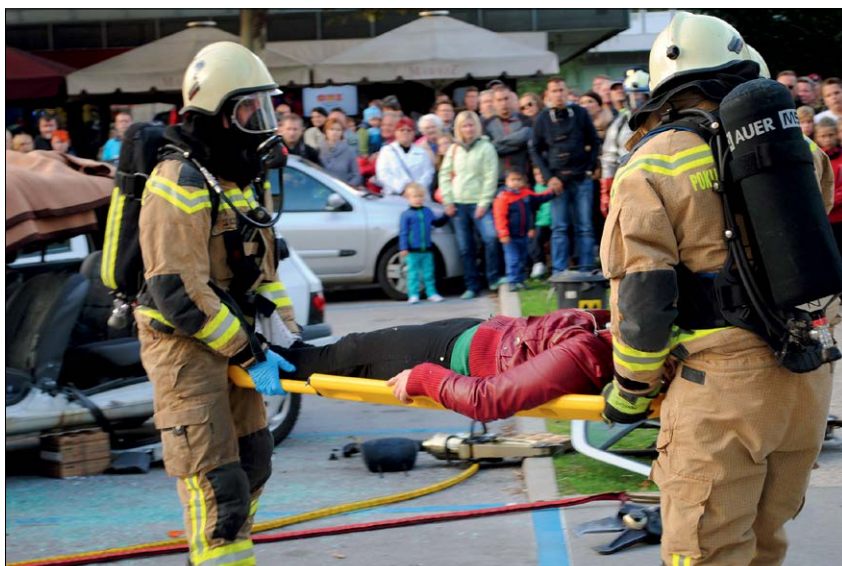
Slika 13: Voznico, ki je bila zaradi trka ujeta v avtomobilu, so gasilci rešili s tehničnim posegom in ji takoj dali prvo pomoč.

Člani ekip prve pomoči CZ in RK se izobražujejo in usposabljujejo po programu Strokovnega centra za prvo pomoč Rdečega križa Slovenije in Izobraževalnega centra za zaščito in reševanje. To je celovito izobraževanje iz prve pomoči, namenjeno ljudem, ki nimajo zdravstvene izobrazbe in traja 70 ur. Usposobijo se za dajanje prve pomoči poškodovanim in obolelim, triažo, pomoč pri dekontaminaciji poškodovanih in obolelih, pomoč pri prevozu lažje poškodovanih in izvajanje higiensko-epidemioloških ukrepov. Znanje in izurjenost obnavljajo in nadgrajujejo na krajših obnovitvenih tečajih, na katerih