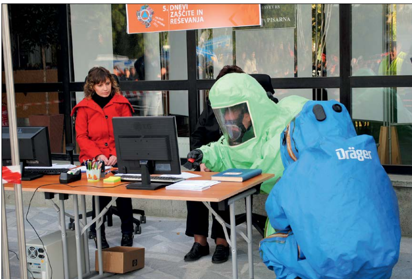
Slika 7: Delovišče št. 2 so organizatorji zaradi vaje pripravili pred zgradbo mestne občine in tako omogočili obiskovalcem, da so lahko videli, kako bi intervencija potekala v zaprtem prostoru.

Predhospitalna enota Velenje je po prihodu na mesto nesreče začela izvajati triažo poškodovancev in jim nudila