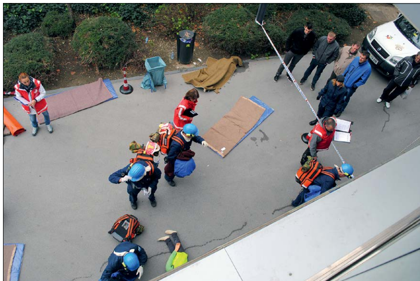
Slika 11: Nenavaden pogled na prihod ekipe prve pomoči na delovno mesto. Pri čiščenju steklenih površin je prišlo do delovne nesreče. (foto: B. Kuntarič)

Vrhunec tretjega dneva prireditve v Velenju je bilo 19. državno preverjanje znanja ekip prve pomoči Civilne zaščite in Rdečega križa, na katerem je prav tako sodelovalo 14 ekip. Od tega si je 13 ekip priborilo pravico do nastopa v Velenju z zmago na regijskih preverjanjih, štirinajsta udeleženka pa je bila ekipa, ki je med vsemi drugouvrščenimi ekipami na regijskih preverjanjih zbrala največ točk.