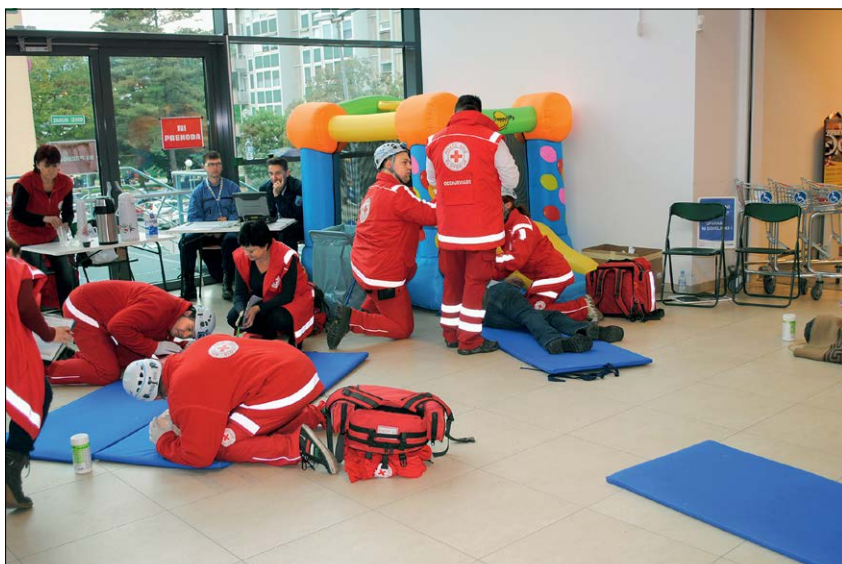
Slika 12: Prikaz reševanja in postopkov prve pomoči, ki so jih posredovali obiskovalcem trgovskega centra.

Delovno mesto št. 3 – eksplozija: Med množično prireditvijo je prišlo do eksplozije umazane bombe. Več oseb je bilo poškodovanih. Posredovala je enota za dekontaminacijo. Ekipa prve pomoči je oskrbela poškodovane osebe.