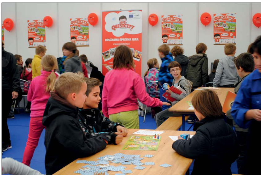
Slika 2: V treh dneh si je prireditev ogledalo več kot 2500 otrok in šolske mladine.

Figure 1: 5 th Protection and Rescue Days were marked by accidents and incidents involving different hazardous materials