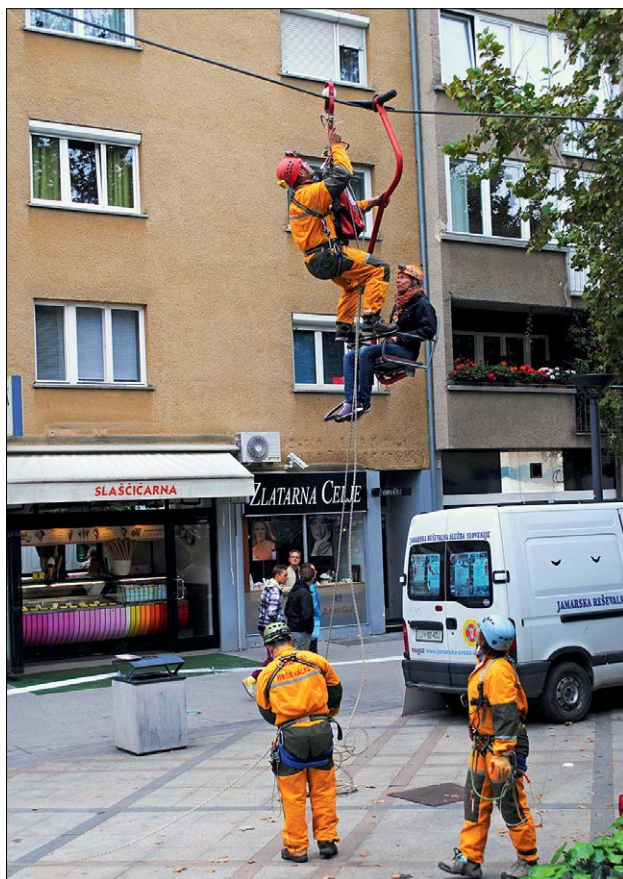
Slika 3: Prikaz reševanja s pokvarjene žičnice

Tretji, zadnji dan prireditve, so bili v ospredju pozornosti obiskovalcev 19. državno preverjanje usposobljenosti ekip prve pomoči Rdečega križa in Civilne zaščite, na stadionu ob jezeru je potekalo tudi tekmovanje gasilskih desetini.