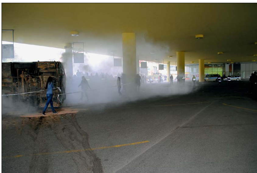
Slika 1: 5. dnevi zaščite in reševanja so minili v znamenju nesreč in nezdog z različnimi nevarnimi snovmi.

Tako kot na vseh prejšnjih dnevih zaščite in reševanja je bil prvi dan namenjen predšolski in šolski mladini. URSZR