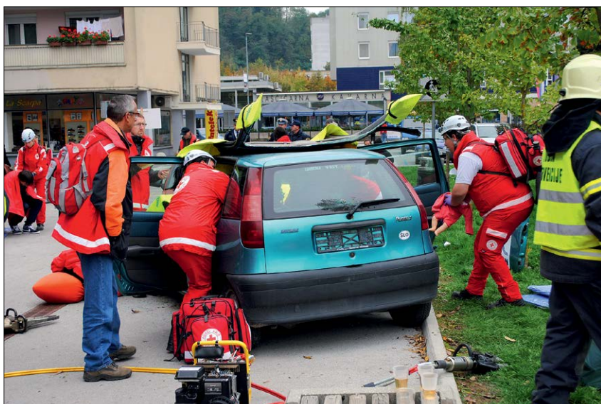
Slika 9: Pri reševanju pri prometni nesreči je imel vsak član ekipe prve pomoči svojo nalogo, ki mu jo je določil vodja.

Na kraj dogodka so najprej prišli policisti, ki so zavarovali prostor, izklopili ventilacijo in omejili gibanje oziroma vstop v prostor. Skupaj z gasilci iz PGD Velenje so določili in označili cone nevarnosti ter pridobili podatke o osebah, ki so bile v stiku s pošiljko. Gasilec z ustrežno stopnjo osebne zaščite je vstopil v prostor, prevzel in prepakiral pošiljko v ustrezno embalažo, izstopil iz kontaminiranega prostora in izvedel postopek dekontaminacije. Praktični prikaz je bil tako zaključen. Sledil je komentar, v katerem so bili predstavljeni nadaljnji postopki predaje snovi,