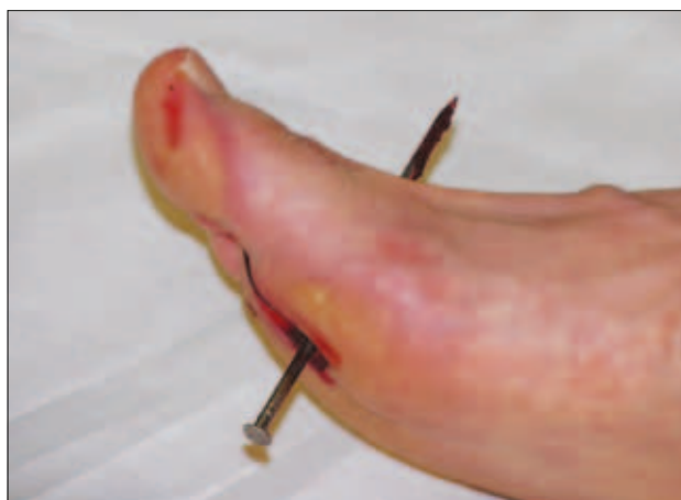
Slika 12: Ponazoritev tujka v stopalu Figure 12: Foreign body in the foot.

usposabljanje in opremljanje ekip. Uprava v dogovoru z RKS in drugimi nevladnimi organizacijami ter občinami organizira do 200 ekip za prvo pomoč, ki lahko delujejo na območju vse države.