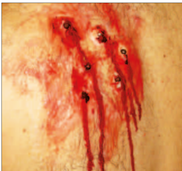
Slika 4: Ponazoritev eksplozivne rane

Figure 4: Explosive wound.