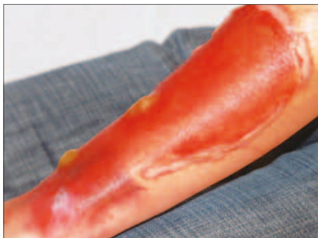
Slika 9: Ponazoritev opekline rane z mehurji