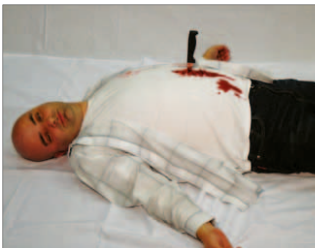
Slika 13: Ponazoritev vbodnine s tujkom (foto: M. Steinbuch)

Figure 13: Stab wound with a retained foreign body (Photo: M. Steinbuch).