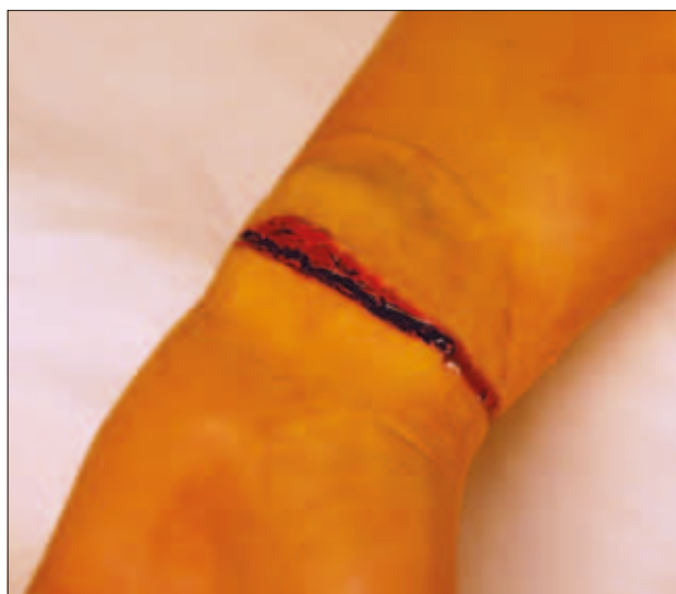
Slika 14: Ponazoritev vreznine

Figure 13: Stab wound with a retained foreign body.