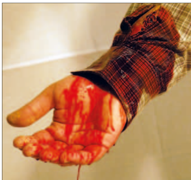
Slika 5: Ponazoritev hujše krvavitve na podlakti (foto: M. Steinbuch)

Figure 4: Explosive wound (Photo: M. Steinbuch).