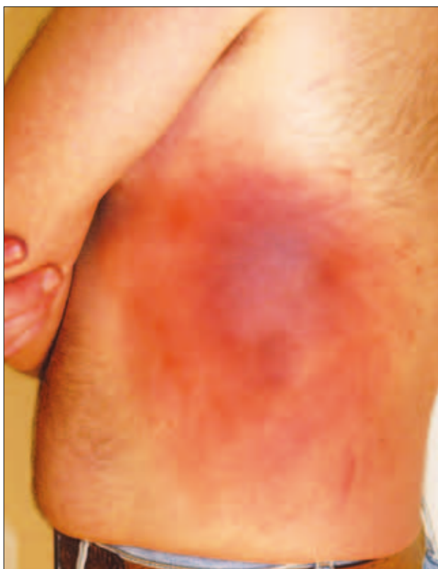
Slika 10: Ponazoritev podplutbe Figure 10: Bruise.