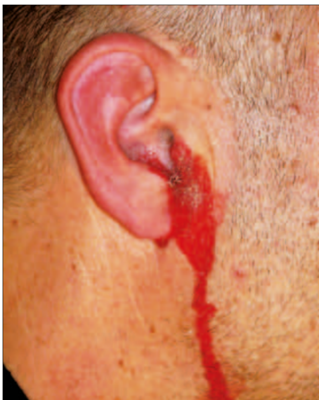
Slika 6: Ponazoritev krvavitve pri zlomu lobanjskega dna