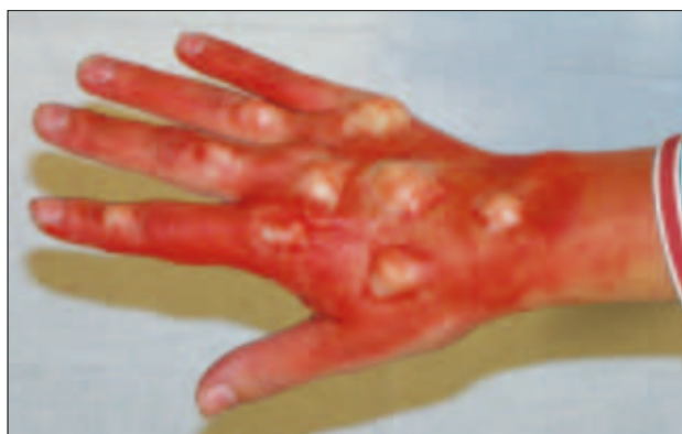
Slika 3: Ponazoritev kontaminacije z bojnimi strupi mehurjevci (foto: M. Steinbuch)

Figure 2: Finger amputation (Photo: M. Steinbuch).