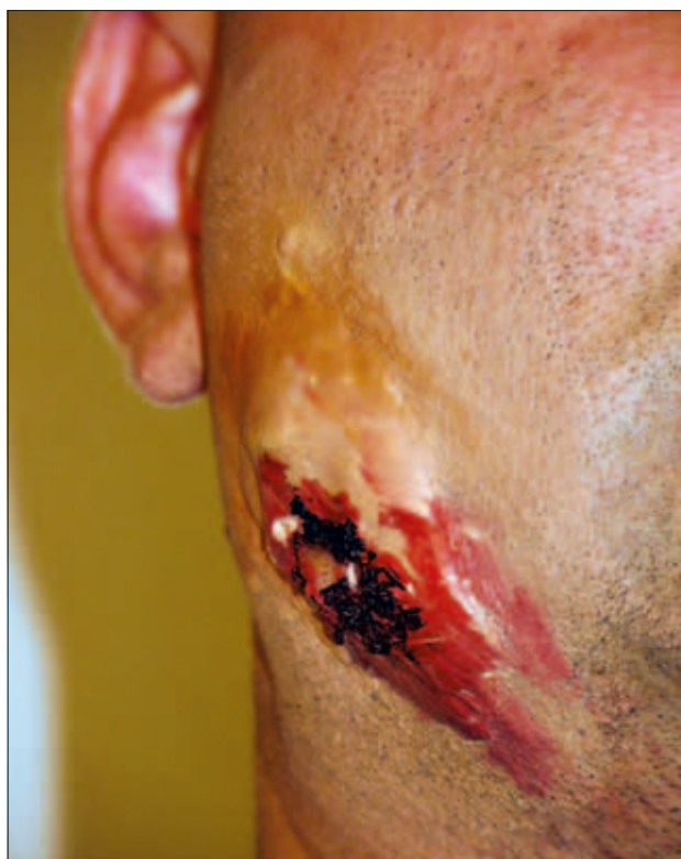
Slika 7: Ponazoritev odprtega zloma spodnje čeljusti