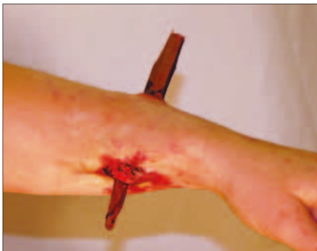
Slika 11: Ponazoritev tujka v podlakti Figure 11: Foreign body in the forearm.

Država prek Uprave Republike Slovenije za zaščito in reševanje (URSZR) zelo dobro skrbi za organiziranje,