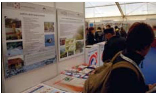
Slika 5. Najbolj obiskano mesto v velikem šotoru je bila info točka, kjer so obiskovalci dobili vse potrebne informacije.

Figure 5. The most frequently visited place in the big tent was the Info Point, where visitors obtained all the information they needed.