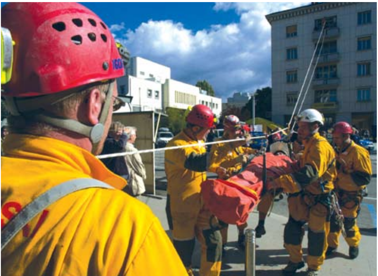
Slika 12. Prikaz reševanja z višin.