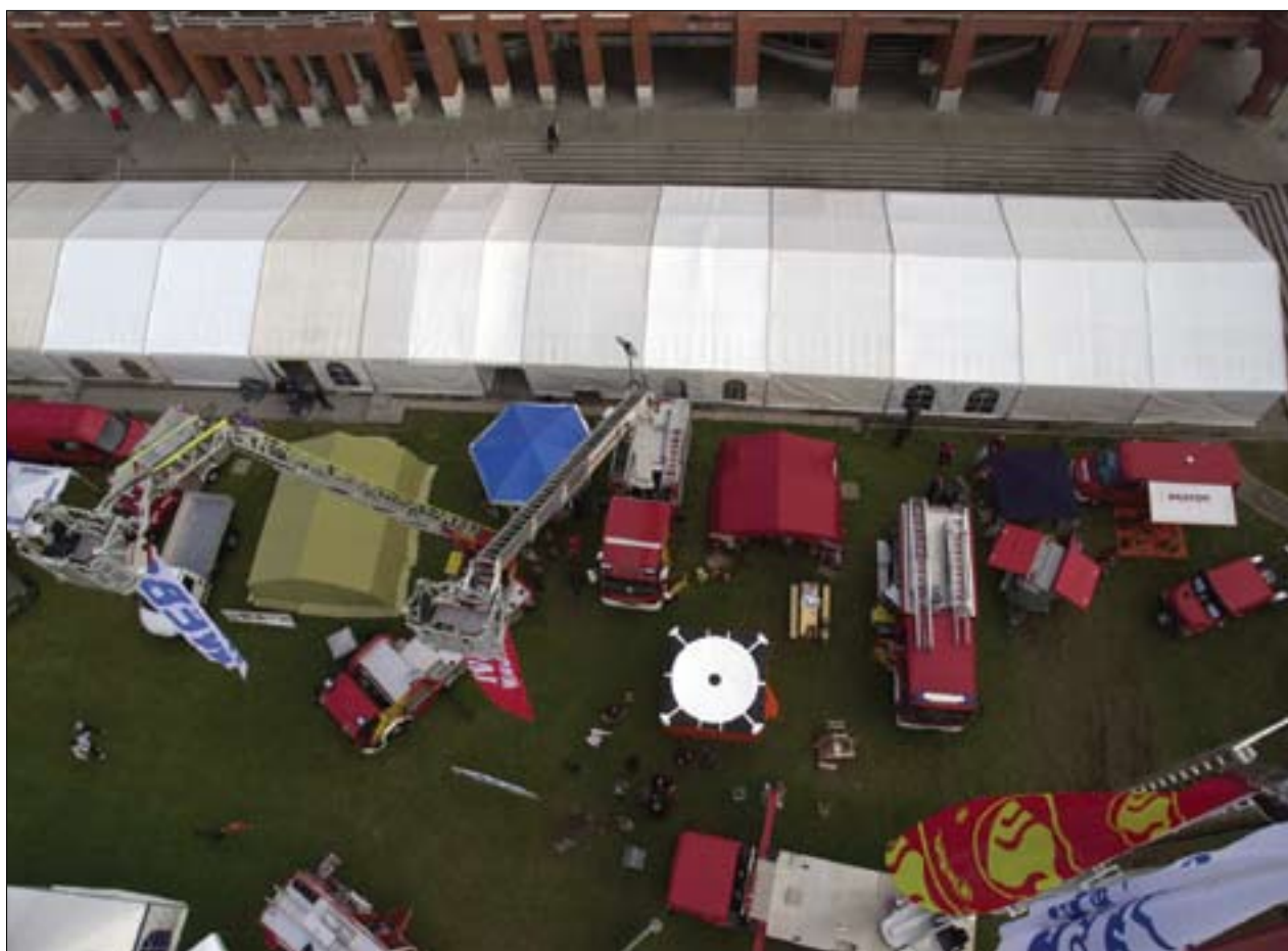
Slika 8. Pogled na del prizorišča dnevov ZiR s ptičje perspektive.