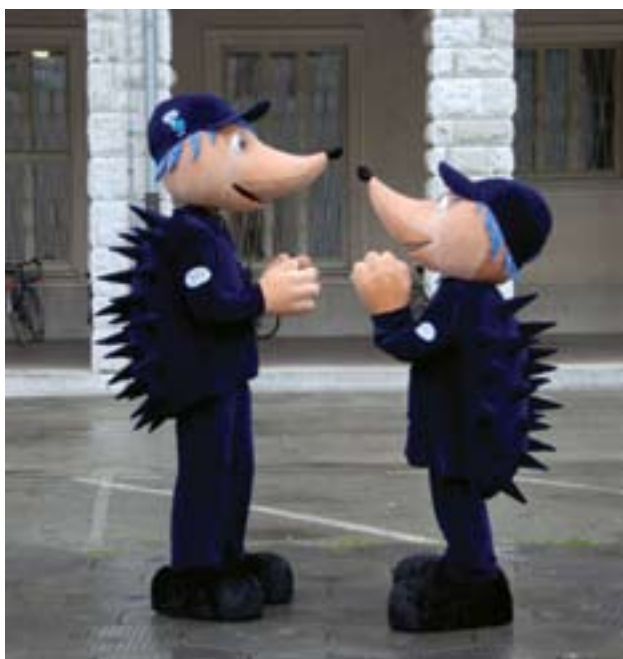
Slika 10. Veliko pozornost obiskovalcev, predvsem otrok, sta pritegnili maskoti URSZR. Figure 10. The Civil Protection and Disaster Relief mascots drew great attention, especially among the children.

Petek, 19. oktobra, je bil predvsem namenjen predšolski mladini s širšega območja Nove Gorice in šolski mladini z območja Vipavske doline, Krasa in celotne Soške doline. Po nekaterih podatkih se je v Novi Gorici zbralo kar 2300 otrok in mladostnikov. Hkrati s tem je potekala predstavitve Slovenske vojske in možnosti za delo v njenih enotah, prostovoljnega služenje vojaškega roka in pogojev za vključitev v pogodbeno rezervo. Ta dan je Gasilska zveza