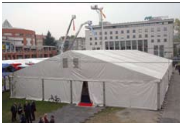
Slika 1. V velikem šotoru pred občinsko zgradbo se je predstavila Uprava Republike Slovenije za zaščito in reševanje in drugi sestavni deli sistema zaščite in reševanja.

zniki izgubljajo življenja, ostajajo invalidi in podobno. Vendar nas najbolj prizadenejo takrat, ko smo sami žrtev takšne ali drugačne nesreče. To še toliko bolj velja za naravne katastrofe, ki so v preteklih nekaj letih prizadele prebi-