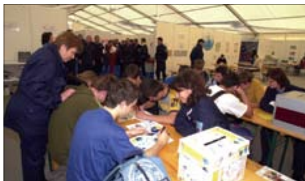
Slika 11. Mladi so lahko reševali tudi kviz na temo zaščite pred naravnimi in drugimi nesrečami. Figure 11. Young people were also able to do a quiz on the topic of protection from natural and other disasters.