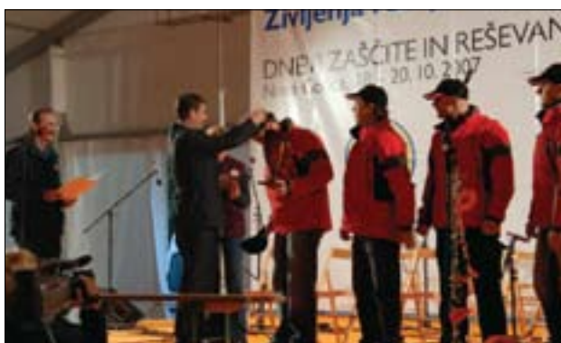
Slika 4. Najboljšim na preverjanju znanja ekip prve pomoči CZ in RKS je pokale in kolajne podelil minister Karl Erjavec.

Nevarnosti naravnih nesreč se pri nas že dolgo zavedamo. Vsak med nami si mora prizadevati za varnost pred naravnimi in drugimi nesrečami. To je naloga vsakega organiziranega okolja in seveda države, zato ima varstvo pred naravnimi in drugimi nesrečami v sistemu