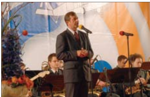
Slika 2. Druge dneve zaščite in reševanja je odprl minister za obrambo Karl Erjavec.