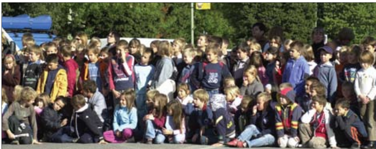
Slika 9. Zvedavi otroški obrazi povedo več kakor tisoč besed. Figure 9. Curious children's faces say more than a thousand words.

obletnici »čudežu pri Kobaridu« ali preboju soške fronte v 1. svetovni vojni. Ob posvetu je bila tudi priložnostna razstava. Drug posvet je bil namenjen obravnavi požarov v naravnem okolju. Obiskovalcem se je z različnimi dejavnostmi predstavil Rdeči križ Slovenije. Med drugim je potekala tudi krvodajalska akcija. Ena od osrednjih prireditev v Novi Gorici pa je bilo državno preverjanje pripravljenosti ekip prve pomoči civilne zaščite in Rdečega križa. Uradna otvoritev prireditve je bila ob 16. uri s priložnostnim programom. Sprva je bilo načrtovano, da bo otvoritvena prireditev na prostem, ob knjižnici Franceta Bevka. Vendar so jo organizatorji zaradi dežja prestavili v šotor na travniku ob novogoriškem