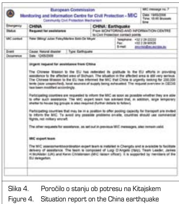
Slika 4. Poročilo o stanju ob potresu na Kitajskem Figure 4. Situation report on the China earthquake

6. operativno sodelovanje z MIC v času, ko je mehanizem CZ aktiviran.