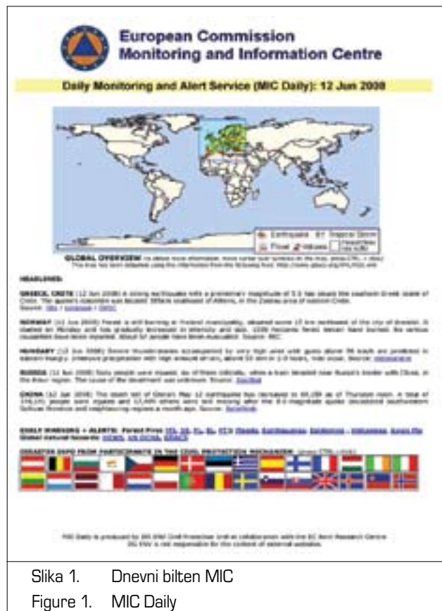
Slika 1. Dnevni bilten MIC Figure 1. MIC Daily

Odločba iz leta 2007 je prinesla tudi nekatere novosti glede vloge predsedujoče države Svetu EU, predvsem pa je vlogo Evropske komisije in predsedujoče države natanč-