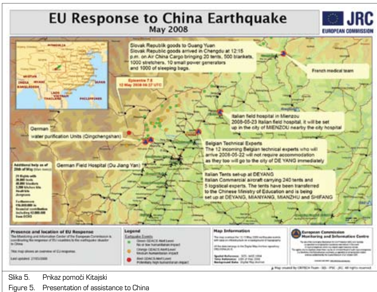
Slika 5. Prikaz pomoči Kitajski Figure 5. Presentation of assistance to China

Na podlagi pridobljene varnostne ocene je koordinacijska skupina za usklajevanje pripravila predlog o načinu aktiviranja in uporabi mehanizma CZ. Usklajen predlog je bil nato prek Centra za obveščanje naslovljen na dežurno službo Ministrstva za zunanje zadeve, ki je predlog predložila imenovanemu nacionalnemu koordinatorju, ki je bil za to nalogo določen s sklepom Vlade RS. Nacionalni koordinator je sprejel odločitev o načinu aktiviranja in uporabi mehanizma CZ, ki je bila nato preko Centra za obveščanje RS naslovljena na MIC. To je bila glavna naloga predsedujoče države Svetu EU v postopkih pred aktiviranjem mehanizma CZ.