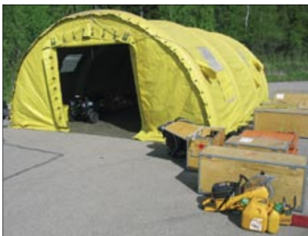
Slika 3. Prikaz dela opreme estonske enote za hitro posredovanje, ki začne delovati ob naravni ali drugi nesreči (tako znotraj kakor tudi zunaj države).

Leta 1997 je bila v okviru Uprave za reševanje ustanovljena državna enota za hitro posredovanje, ki začne delovati ob naravnih ali drugih nesrečah (tako znotraj kakor tudi zunaj države). Enota sestavlja več modularno oblikovanih reševalnih skupin, na primer skupina za iskanje in reševanje, skupina za tehnično reševanje, skupina za radiološko, kemično in biološko zaščito, enota za eksplozivna ubojna sredstva, enota za nudenje zdravniške (nujne medicinske) pomoči in enota za oskrbo, ki lahko opravljajo različne dejavnosti zaščite, reševanja in pomoči ter jih je moč poslati v tujo državo v dvanajstih do štiriindvajsetih urah. Enota je sodelovala že pri več mednarodnih vajah zaščite in reševanja ter resničnih katastrofalnih nesrečah. Tako je na primer konec leta 2005 in v začetku leta 2006 nudila reševalno pomoč Indoneziji, ki jo je prizadel katastrofalen cunami in še istega leta tudi Pakistanu pri iskanju in reševanju zasutih oseb zaradi potresa. Vsega skupaj je bila udeležena v dvanajstih mednarodnih reševalnih operacijah.