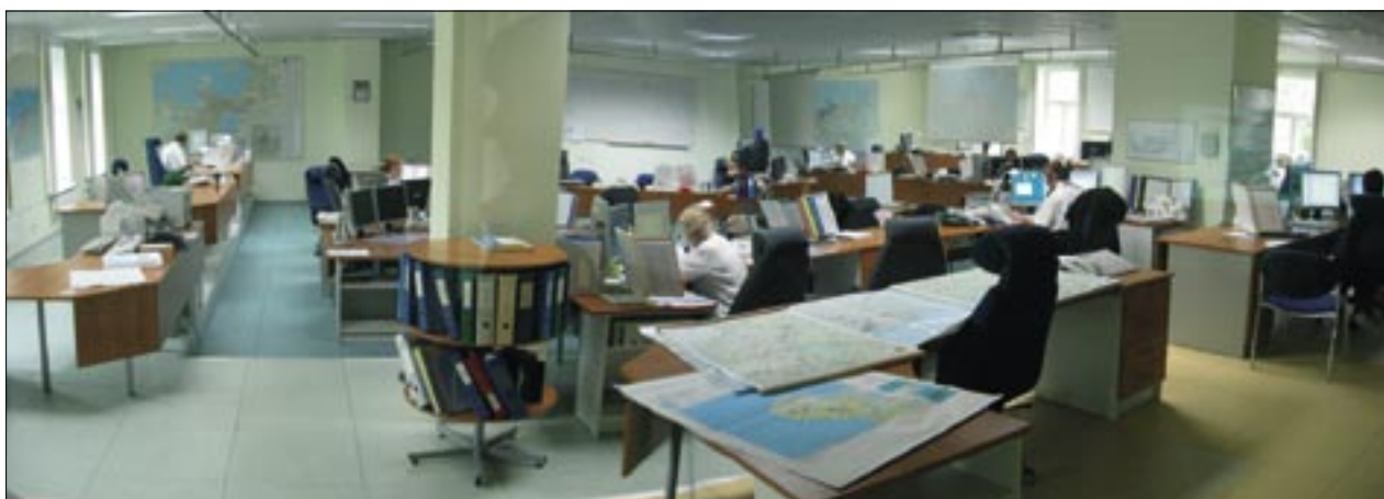
Slika 2. Estonski regijski center za obveščanje aktivira gasilsko in druge reševalne službe ter reševalno službo nujne medicinske pomoči.