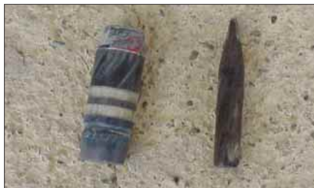
Slika 6. O uporabi in nevarnosti izstrelkov iz osiromešene- ga urana na Kosovu se bodo še dolgo kresala mnenja Figure 6. The use of depleted uranium missiles in Kosovo and their hazards will continue to be a controversial topic

V letu 2000 se je na deloviščih ITF zgodilo šest nesreč v BiH (skupaj je letos v BiH umrlo osem deminerjev) in dve v Albaniji. Pri tem je umrl 1 deminer, 4 so bili ranjeni, ranjen pa je bil tudi pes, ki ga uporabljajo pri razminiranju. Največ žrtev v BiH je povzročila najnevarnejša mina, to je PROM. Poleg rednih nesreč pri delu se je na našem delovišču na območju Republike Srbije zgodila zelo tragična nesreča, v kateri sta izgubila življenji dva inšpektorja Mine Action Centra Republike Srbije (RS MAC). Ta nesreča je primer popolnega neupoštevanja postopkov in tudi zdrave pameti. Delovišče, kjer je enota odkrila dve globoko vkopani fugasi (v globini 1,5 m), smo zaprli do sprejetja odločitve, kako odstraniti ti dve fugasi. Napovedan je bil sestanek vseh vpletenih, da bi se dogovorili, kako naprej. Inšpektorja pa sta dan pred tem z lopato in krampom poskušala ugotoviti stanje in sta ga odkrila. To so primeri, ko te zgrabi jeza in ne razumeš, kaj se ljudem (oba sta bila strokovnjaka na tem področju) pleče v glavi.