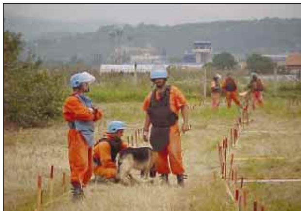
Slika 3. Uporaba psa pri razminiranju in kontroli kvalitete je učinkovit pripomoček, ki skupaj z deminerjem predstavlja dober tim

Po koncu sovražnosti in podpisu mirovnega sporazuma so posamezne vojske IFOR-ju izročile veliko zapisnikov o minskih poljih. Do avgusta 1997 je imel United Nations Mine Action Co-ordination Centre (UN MACC) zapisnike 17.584 minskih polj, ki vsebujejo 286.000 min. Ti zapisniki naj bi zajeli približno polovico minskih polj v BiH. V BiH ocenjujejo, da je približno 300 km 2 ozemlja miniranega z okoli 30.000 minskimi polji. Na tem območju naj bi bilo okoli 750.000 min in okoli 250.000 NUS. Sodeč po predanih zapisnikih, je približno 4757 minskih polj v Republiki Srbski, preostanek v Federaciji BiH. Najbolj minirano območje je v širini 4 km v obeh smereh od linije spopada in na mestih, od koder so se vojskujoče strani umaknile. Veliko miniranih območij najdemo tudi v t. i. etničnih žepih.