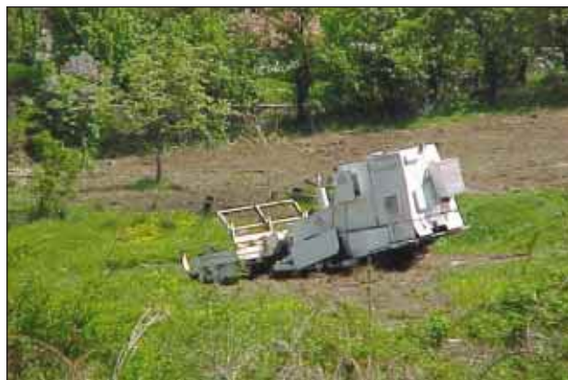
Slika 4. Uporaba strojev je pomemben del razminiranja, ki vpliva na učinkovitost

Kot v BiH so bile tudi v spopadih na Hrvaškem mine uporabljene v velikih količinah. Po podatkih Hrvaškega centra za razminiranje (HCR), da je na ozemlju Hrvaške do 1,2 milijona min in NUS. Od 21 županij jih je kar 14 minsko onesnaženih. Najbolj minsko onesnažena so območja Slavonije, Baranje, Posavine, Banovine, Like in Dalmacije. Po podatkih HCR-ja ima Hrvaška približno 4500 km 2 sumljivih površin, od tega je 500 km 2 onesnaženih z minskimi polji, preostalih 4000 km 2 pa se razteza na območju 500 metrov na vsako stran od bojne črte in je onesnaženo s posameznimi minami oz. NUS.