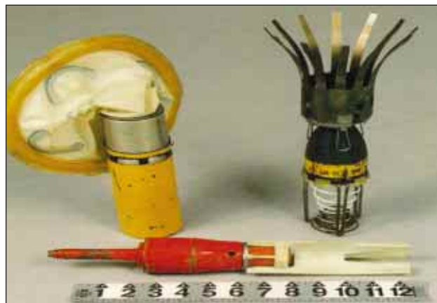
Slika 5. Najpogosteje uporabljene vrste kasetnic na Kosovu BL97, BLU755 in Mk118

Figure 5. Most frequently used cluster bombs in Kosovo: BL97, BLU755 and Mk118