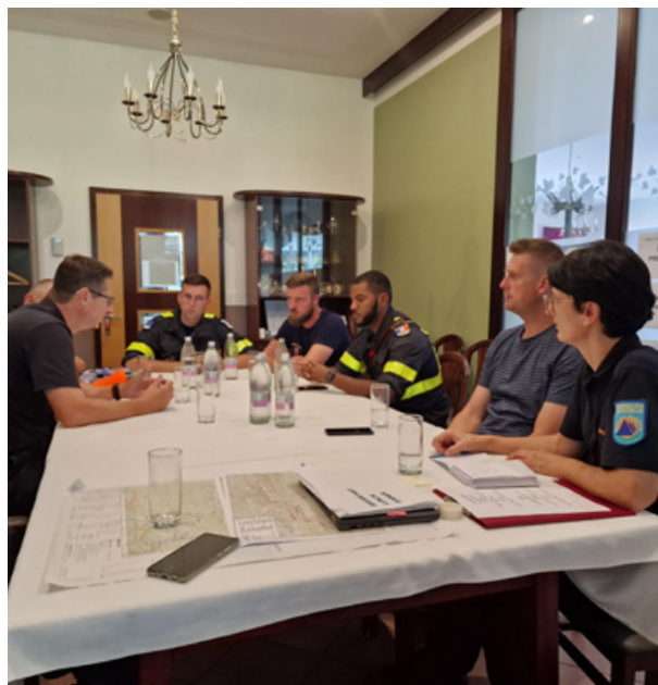
Slika 8: Koordinacijski sestanek francoske ekipe z regijskim štabom Civilne zaščite in VGP Drava Ptuj

Figure 8: Coordination meeting of the French team with the Regional Civil Protection Headquarters and the water management company VGP Drava Ptuj.