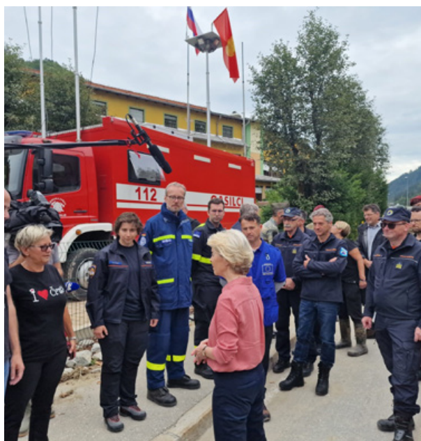
Slika 10: Obisk predsednice Evropske komisije Ursule von der Leyen v Črni na Koroškem, 9. avgust 2024

Pomembna je bila tudi komunikacija z avstrijskimi pristojnimi organi, ki so ves čas trajanja intervencije zagotavljali oprostitev cestnine in spremstvo za ekipe, ki so zaradi dajanja pomoči Sloveniji potovale