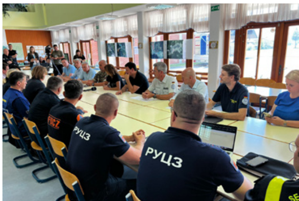
Slika 9: Usklajevalni sestanek in obisk visokih gostov na Rečici ob Savinji, 14. avgust 2024 (foto: arhiv URSZR)

Figure 9: Coordination meeting and visit of distinguished guests in Rečica ob Savinji on 14 August 2024 (Photo: ACPDR archive).