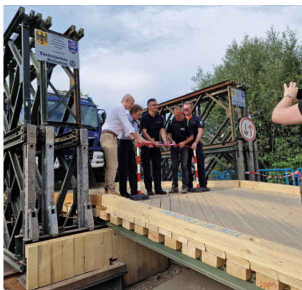
Slika 13: Odprtje mostu na Prevaljah, ki ga je postavila ekipa Zvezne agencije za tehnično reševanje iz Nemčije, 16. avgust 2023. (foto: arhiv URSZR)

Figure 12: The opening of the bridge in Gornji Grad set up by a team from Poland, 13 September 2023 (Photo: ACPDR archive).