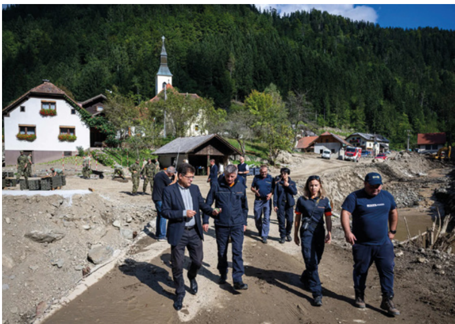
Slika 11: Obisk evropskega komisarja Janeza Lenarčiča v Savinjski dolini, 16. september 2023

Figure 11: European Commissioner Janez Lenarčič visiting the Savinja valley, 16 September 2023.