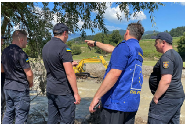
Slika 7: Usklajevanje dela z ekipo iz Ukrajine na delovišču v Savinjski dolini, avgust 2023

Figure 7: Coordination with the Ukrainian team at the work site, in Savinja valley, August 2023.