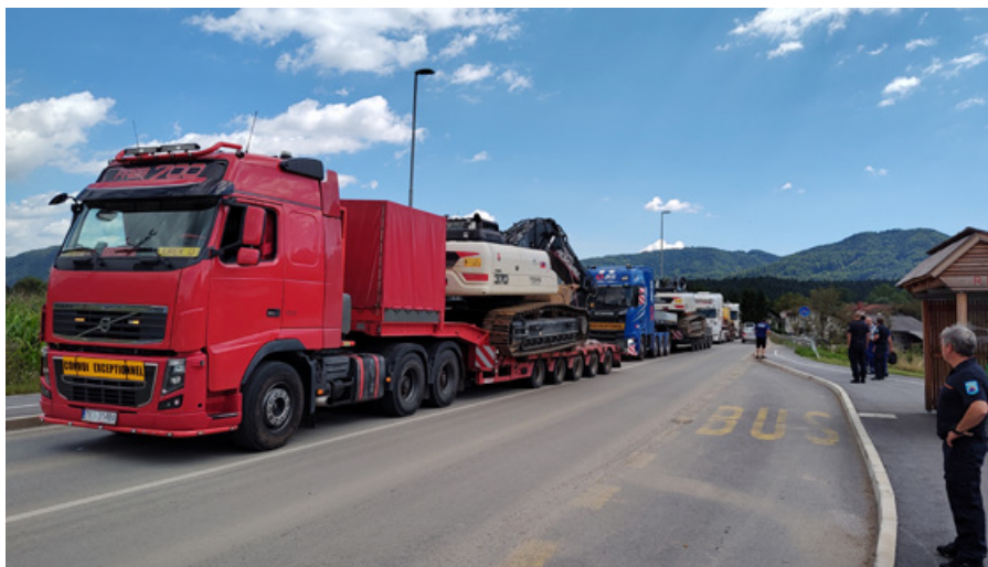
Slika 5: Prihod slovaške ekipe z bagri, 11. avgust 2024 (foto: arhiv URSZR)

Figure 5: The arrival of the Slovak team with excavators, 11 August 2024 (Photo: ACPDR archive).