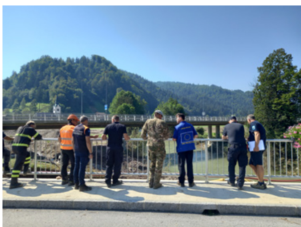
Sliki 6 in 6a: Italijanska ekipa ob ogledu delovišč, 11. avgust 2023

Služba za podporo Štabu Civilne zaščite Republike Slovenije ob poplavih je bila vzpostavljena s sklepom poveljnika Civilne zaščite Republike Slovenije 4. avgusta 2023. O razmerah v Sloveniji so bile obveščene mednarodne kontaktne točke, naloge podpore države prejemnice pa so se začele izvajati dva dni