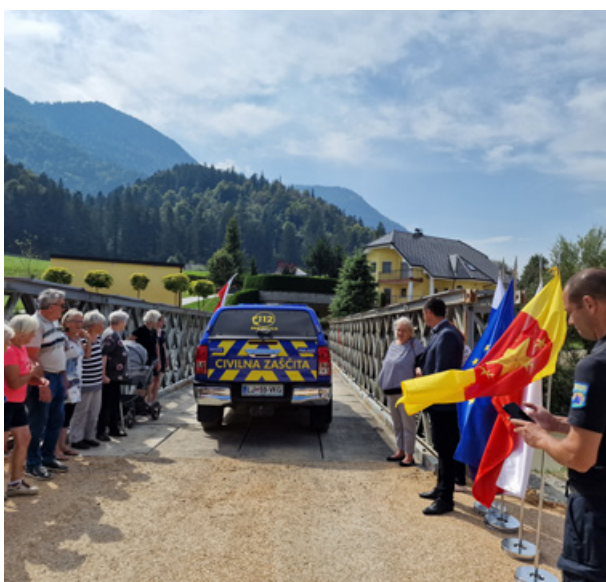
Slika 12: Odprtje mostu v Gornjem Gradu, ki ga je postavila ekipa iz Poljske, 13. september 2023.

Območja delovanja tujih enot in namestitveno bazo so obiskali predstavniki nacionalnih organov iz držav pošiljateljic, predstavniki veleposlaništev, v spremstvu slovenskih političnih predstavnikov in pristojnih organov za zaščito in reševanje. Med drugimi