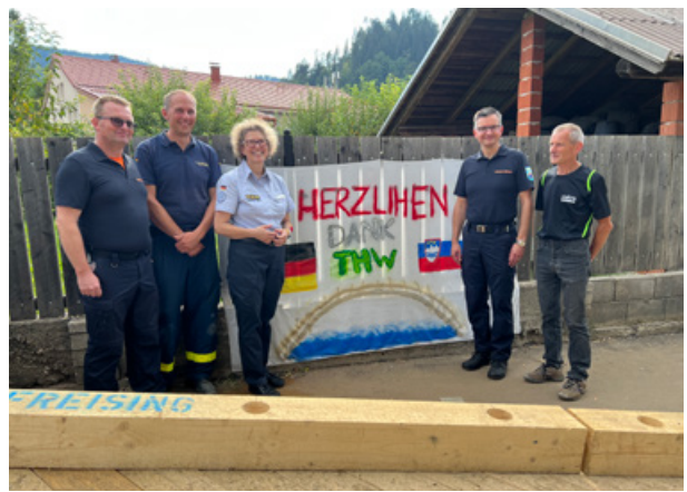
Slika 14: Zahvala prebivalcev za postavitev mostu na Prevaljah