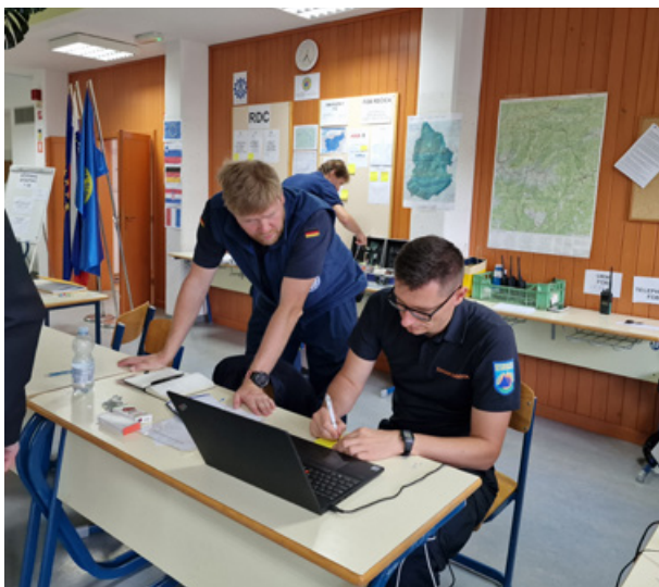
Slika 2: Sprejemno mesto na Rečici ob Savinji

Figure 2: Reception and departure center in Rečica ob Savinji