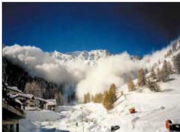
Slika 2. Tako se nam je bližal plaz. Figure 2. The approaching avalanche

Nenadoma je grozovit pok omrtvil vsa naša čutila. Prihajal je od zunaj. Skočil sem k oknu in s pogledom zajel ozko dolino. Z južnega pobočja 2750 m visoke gore Piz Ot, ki se dviga več kot 900 m strmo nad Samnaunom, je hrnel proti našemu kraju snežni plaz, ki je v naslednjem trenutku s snežnim pišem zakril vsak pogled. Zavedal sem se, da mi je glava podzavestno zlezla med ramena. Kaj bo sledilo? So hiše dovolj trdno zgrajene? Strašansko sem si želel, da bi čim prej lahko videl, kaj se dogaja okoli nas. Več kot osem minut je trajalo, da se je belina piša polegla.