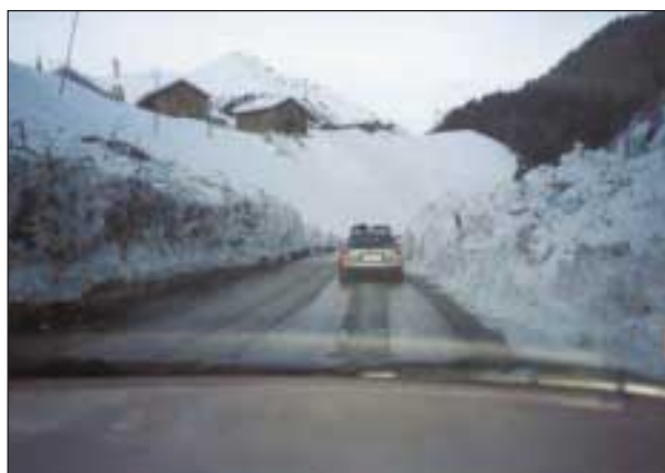
Slika 5. Ob cesti je viden plaz z ostanki dreves in drugega

Figure 5. The avalanche can be seen near the road, with the remains of trees and other debris.