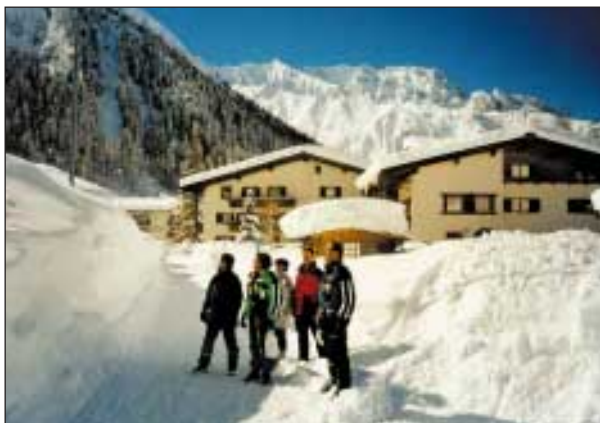
Slika 4. Kraj je pokrit s 4,2 m debelo snežno odejo

Smučišča so bila idealna in vrhunsko urejena. Vreme je bilo enkratno, vendar smo se kljub temu počutili neprijetno, ker smo srečevali tako malo smučarjev. Smučali smo tudi v dolino Paznaun in dosegli Ischgl. Kraj je deloval turobno. Le tu in tam je bil kakšen človek. Večina hotelov in apartmajskih hiš je bilo zaprtih.