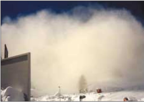
Slika 3. Še nekaj sekund in Samnaun bo zakril snežni piš

Figure 3. A few seconds before Samnaun disappeared in an avalanche of snow.