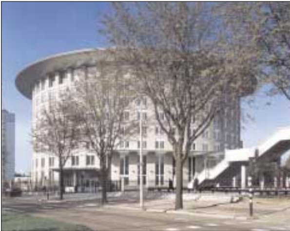
Slika 3. Sedež Organizacije za prepoved kemičnega orožja v Haagu (vir: promocijska brošura OPCW: Chemical Disarmament, Basic Facts, letnik 1999)

Figure 3. The OPCW headquarters in the Haag (source: promotional brochure OPCW: Chemical Disarmament, Basic Facts, 1999 edition)