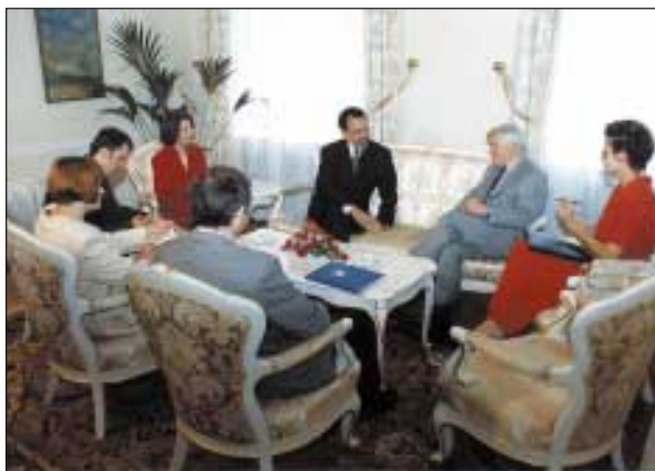
Slika 6. Obisk generalnega direktorja J. M. Bustanija v Sloveniji; na sliki s predsednikom republike Slovenije Milanom Kučanom

OPCW organizira tečaje za usposabljanje inšpektorjev in delavcev v pristojnem organu za uresničevanje konvencije ter delavnice, na katerih se izmenjujejo izkušnje pri uresničevanju. Večinoma OPCW tudi poravnata stroške udeležbe.