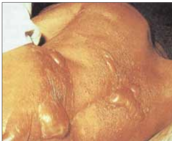
Sliki 1. in 2. Telesne poškodbe, ki jih povzroči kemično orožje, katerega uporaba, žal, še vedno ni preteklost. (vir: promocijska brošura OPCW: Chemical Disarmament, Basic Facts , letnik 1999)

Figures 1. and 2. Body injuries caused by chemical weapons which are, regrettably, still used today. (source: OPCW promotional brochure: Chemical Disarmament, Basic Facts , 1999 edition)