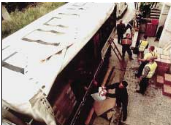
Slika 4. Dostava človekoljubne pomoči v Prištini – skladišče FOCUS -a Granica

Glavna prevozna sredstva so tovornjaki in letala EMERCOM -a iz Rusije. To je tudi temeljna dejavnost te države v FOCUS-u.