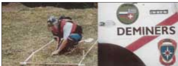
Slika 3. Strokovnjak za razminiranje EMERCOM Rusija dela pod okriljem FOCUS -a

V tem času so hkrati potekali tudi obnova in gradnja šol ter določeni ekološki projekti. FOCUS je sodeloval tudi pri razminiranju na območju Prištine.