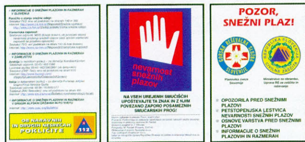
Slika 2. 5. in 6. stran, ter naslovnica zgibanke Pozor, snežni plaz!

smučarjev nas opozarja, da pretijo snežni plazovi tudi na druge in ne le na turne smučarje. To še posebej velja za območja zunaj urejenih smučišč ali pa na smučarskih progah v času, ko so te zaradi snežnih plazov zaprte. Ob robu plakata so še grafični znaki GRS in URSZR ter telefonska številka 112, namenjena nujnim klicem v primeru naravnih in drugih nesreč.