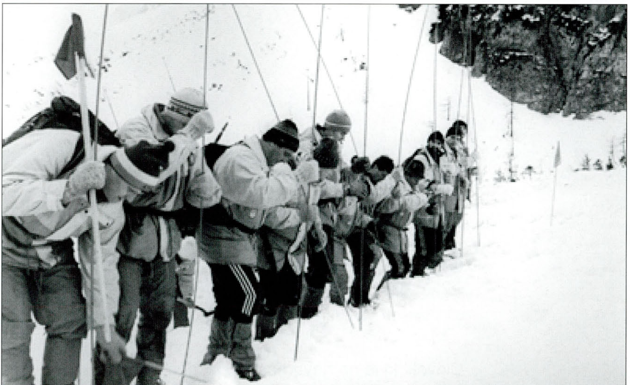
Slika 1. Vaja gorskih reševalcev - plaz z Begunjščice

Poškodovanim, preminulim in pogrešanim so morali pomagati prisotni sodelavci, svojci in sosedi. Ker je bilo v gorah vse več nesreč zaradi osvajanja alpskega sveta, so