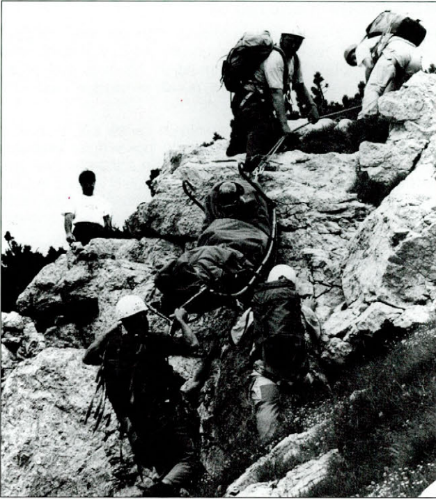
Slika 3. Slovenski gorski reševalci pomagajo avstrijskim kolegom

Figure 3. Slovenian mountain rescuers assist their Austrian colleagues