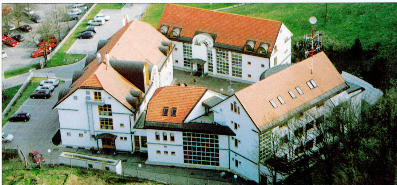
Slika 1. Osrednji objekt centra Figure 1. The Centre's main facility

varstvu pred naravnimi in drugimi nesrečami, ki določa, da se "za izobraževanje in usposabljanje s področja varstva pred naravnimi in drugimi nesrečami pri Upravi Republike Slovenije za zaščito in reševanje ustanovi Izobraževalni center za zaščito in reševanje Republike Slovenije", ki je organizacijska enota Uprave RS za zaščito in reševanje Ministrstva za obrambo.