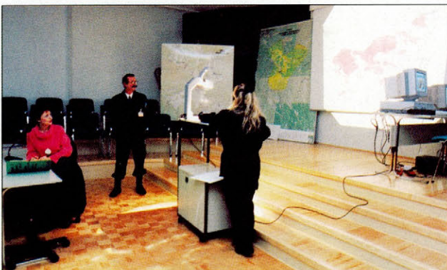
Slika 4. Sodoben način predavanja vključuje tudi avdiovizualna sredstva Figure 4. Modern teaching methods also include audio-visual aids

Leta 1994 je Izobraževalni center za zaščito in reševanje Republike Slovenije začel delati v nedograjenih objektih, brez vadbenih objektov in poligonov. Zaradi tega so v centru potekala le nekatera (najnujnejša) usposabljanja pripadnikov Civilne zaščite in izobraževanje za pridobitev