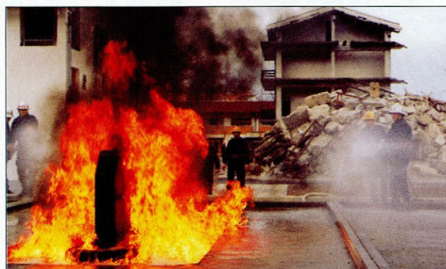
Slika 3. Gasilske vaje na poligonu Figure 3. Firefighters' exercises on training grounds