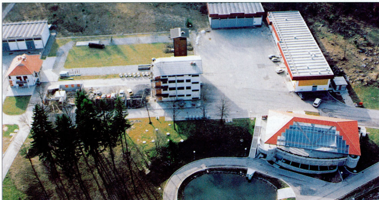
Slika 2. Vadbeni poligoni Figure 2. Exercise grounds

Center želi postati središče izobraževanja in usposabljanja s področja varstva pred naravnimi in drugimi nesrečami v Sloveniji. S posredovanjem svojih izkušenj, kadrovskega in materialnega zmogljivosti sodeluje tudi pri usposabljanju sil za zaščito, reševanje in pomoč na nižjih ravneh. Za doseg te temeljnih ciljev smo vzpostavili stike z drugimi strokovnimi in znanstveno-raziskovalnimi organizacijami in ustanovami v državi ter podobnimi centri v tujini. Na ta način poskušamo izvajati naše temeljne naloge, ki so: