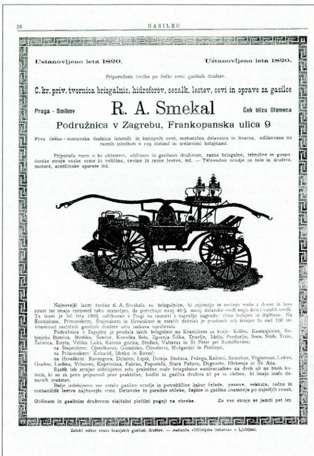
Slika 2. Oglas podjetja "R. A. Smekal" v Gasilcu leta 1905 Figure 2. Advertisement of the company "R. A. Smekal" published in the Gasilec (Fireman) magazine in the year 1905

gasilnih društev Trošt, Papler, Štriclej, Barle, Leutgeb, Vilfan in Roblek.